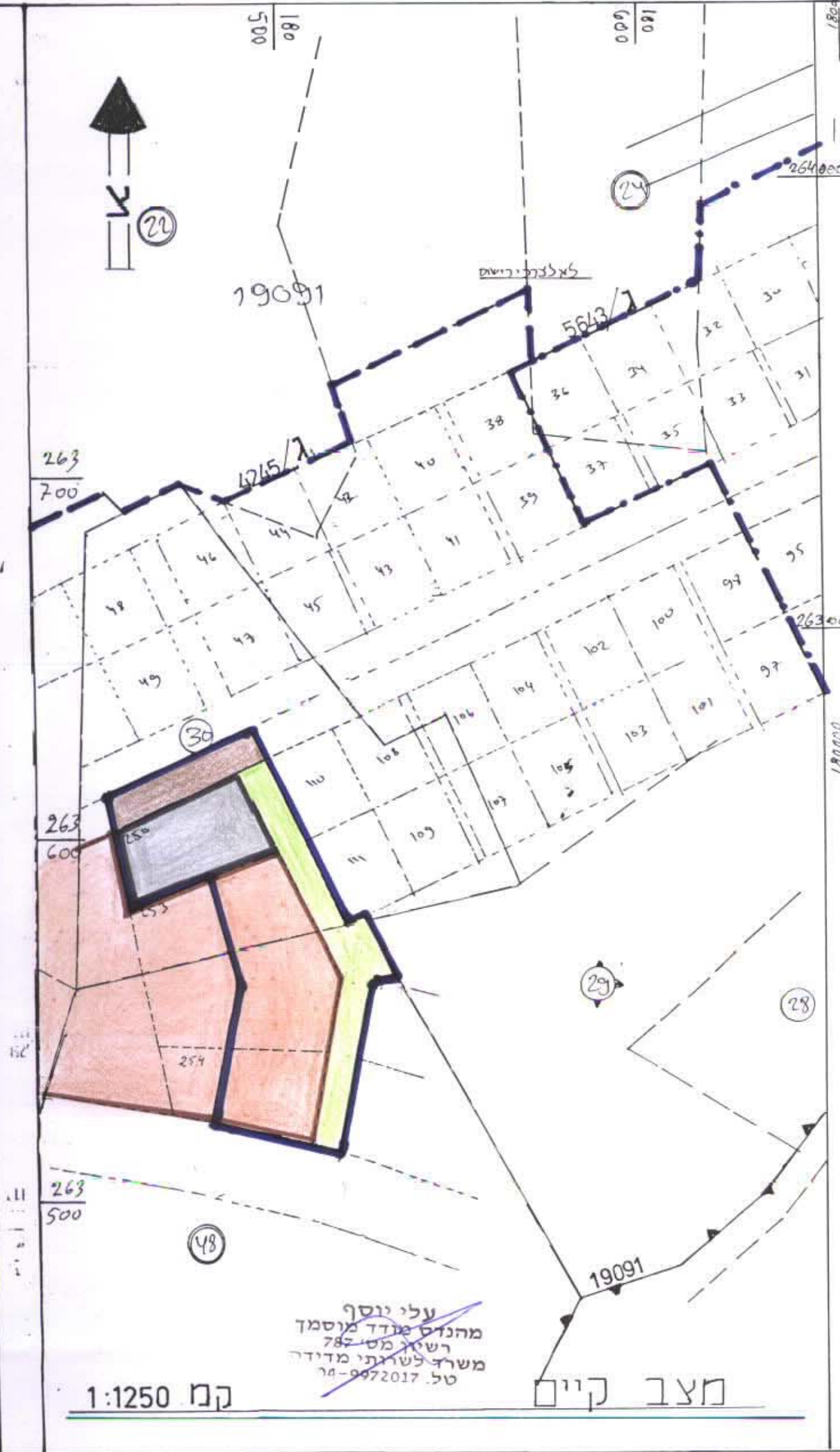
מצב קיים קמ"מ 1:1250

משרד הפנים מחוז הצפון ועק התכנון והבניה חש"ב"ה - 1965 הפקדת תכנית מס' 11090/ג הועדה המחוזית לתכנון ולבניה החליטה ביום 24.7.95 להפקיד את התכנית. יו"ר הועדה המחוזית חודעה על הפקדת תכנית מס' 11090/ג מורסמה בילקוט הפרסומים מס' _____ מיום _____ חודעה על הפקדת תוכנית מס' 11090/ג מורסמה בעיתון _____ ביום _____ בעיתון _____ ביום _____ ובציון מקומי _____ ביום _____