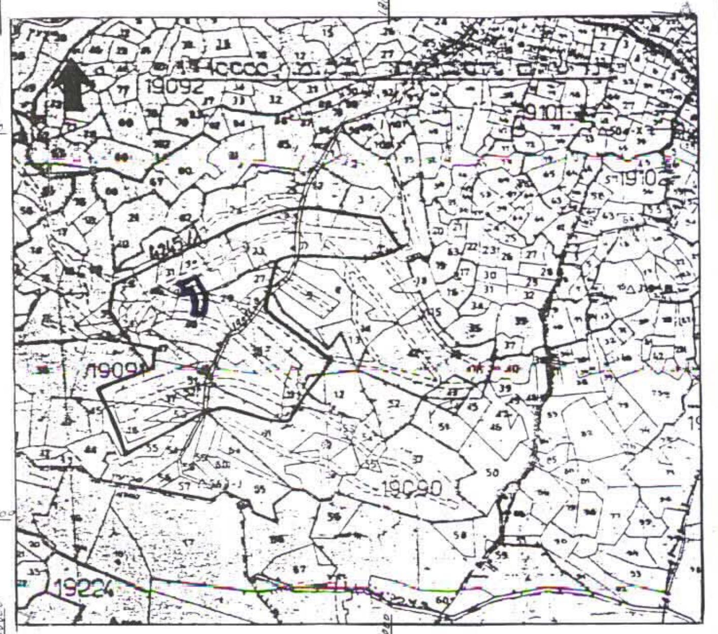
תרשים הסביבה קנ"מ 1:10000

חודעה על אישור תכנית מס' 11090/ג מורסמה בילקוט הפרסומים מס' 4895 מיום 21.6.95