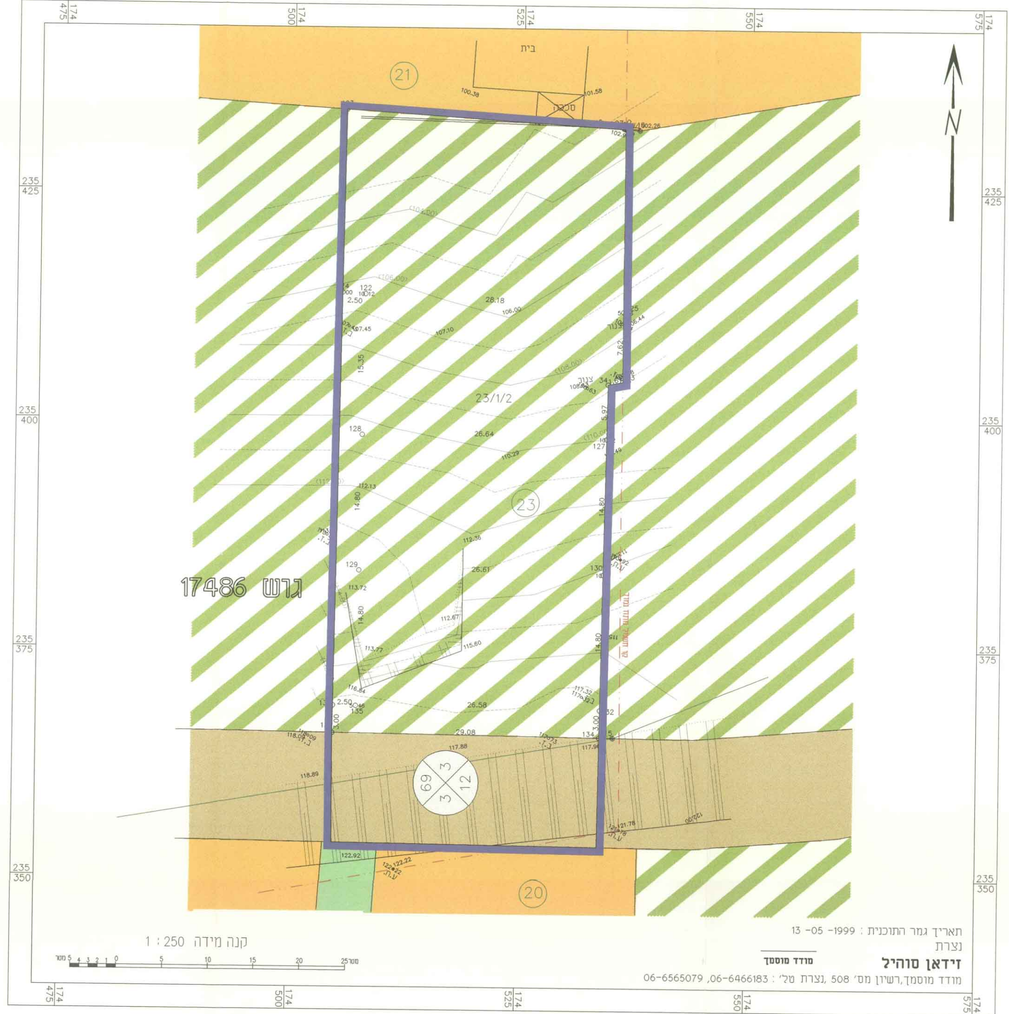
מצב קיים קני"מ 1:250

תאריך גמר התוכנית: 13-05-1999 נצרת זידאן סוהיל מודד מוסמך, רשיון מס' 508, נצרת טל': 06-6466183, 06-6565079