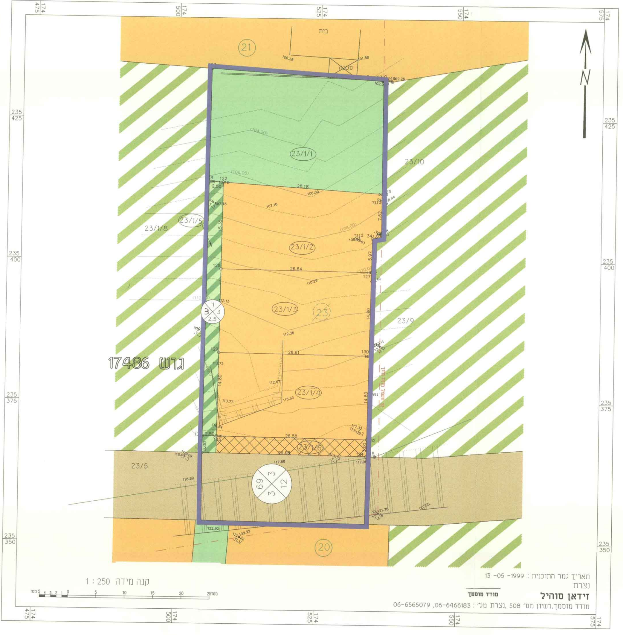
מצב מוצע קני"מ 1:250

תאריך גמר התוכנית: 13-05-1999 נצרת זידאן סוהיל מודד מוסמך, רשיון מס' 508, נצרת טל': 06-6466183, 06-6565079