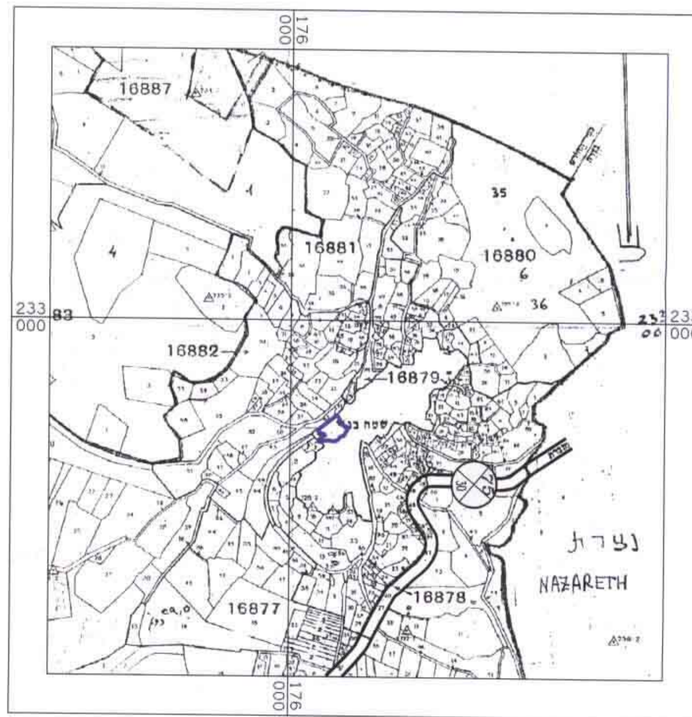
תרשים סביבה קנ"מ 1:10000

משרד הפנים חוק התכנון והבניה אישור תכנית מס' 10252/א העירייה המקומית כפר יפיע ביום 10.6.00 יו"מ