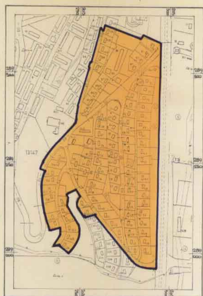
תרשים הסביבה - 1:5000