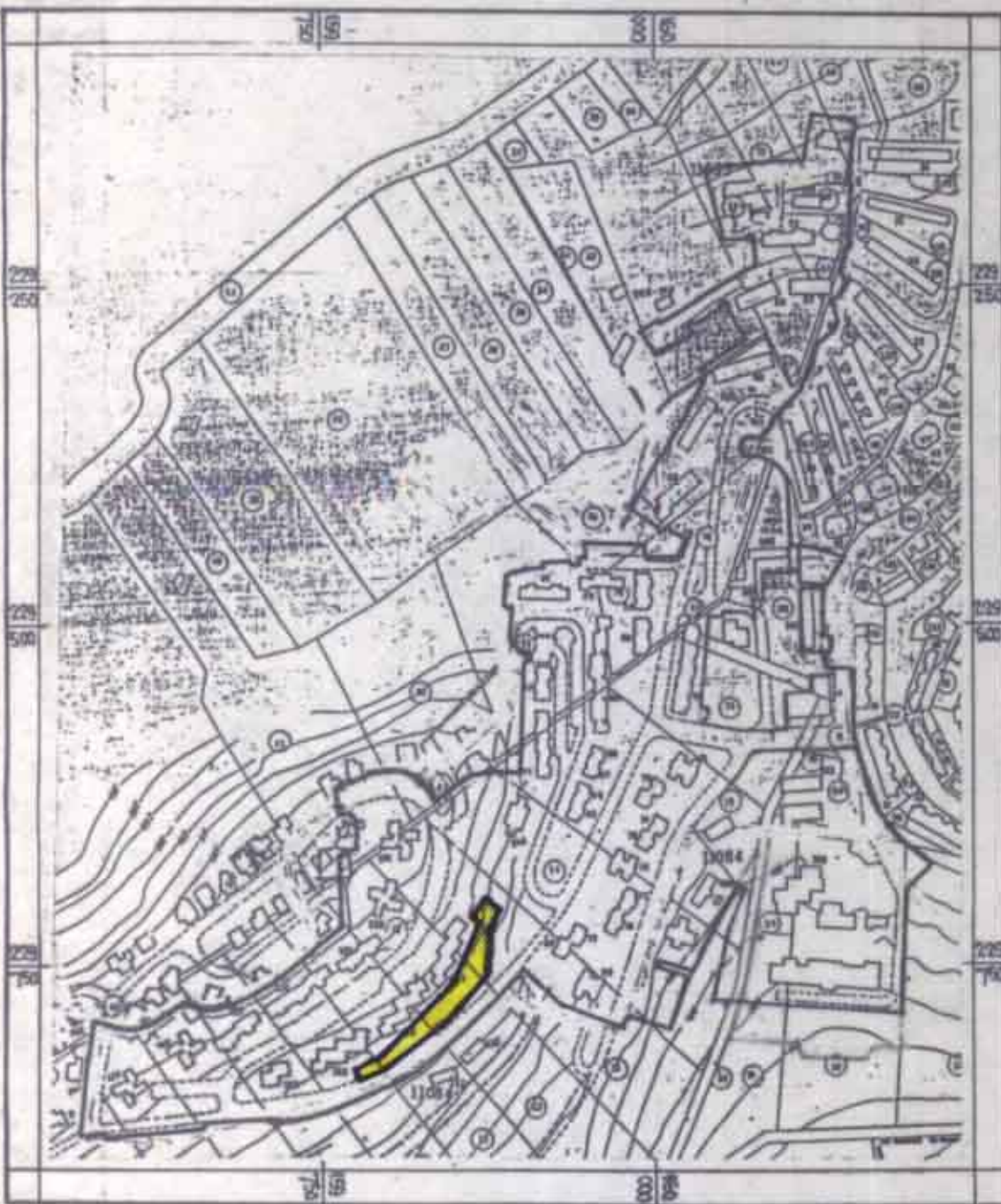
תרשים הטביבה - 1:5000