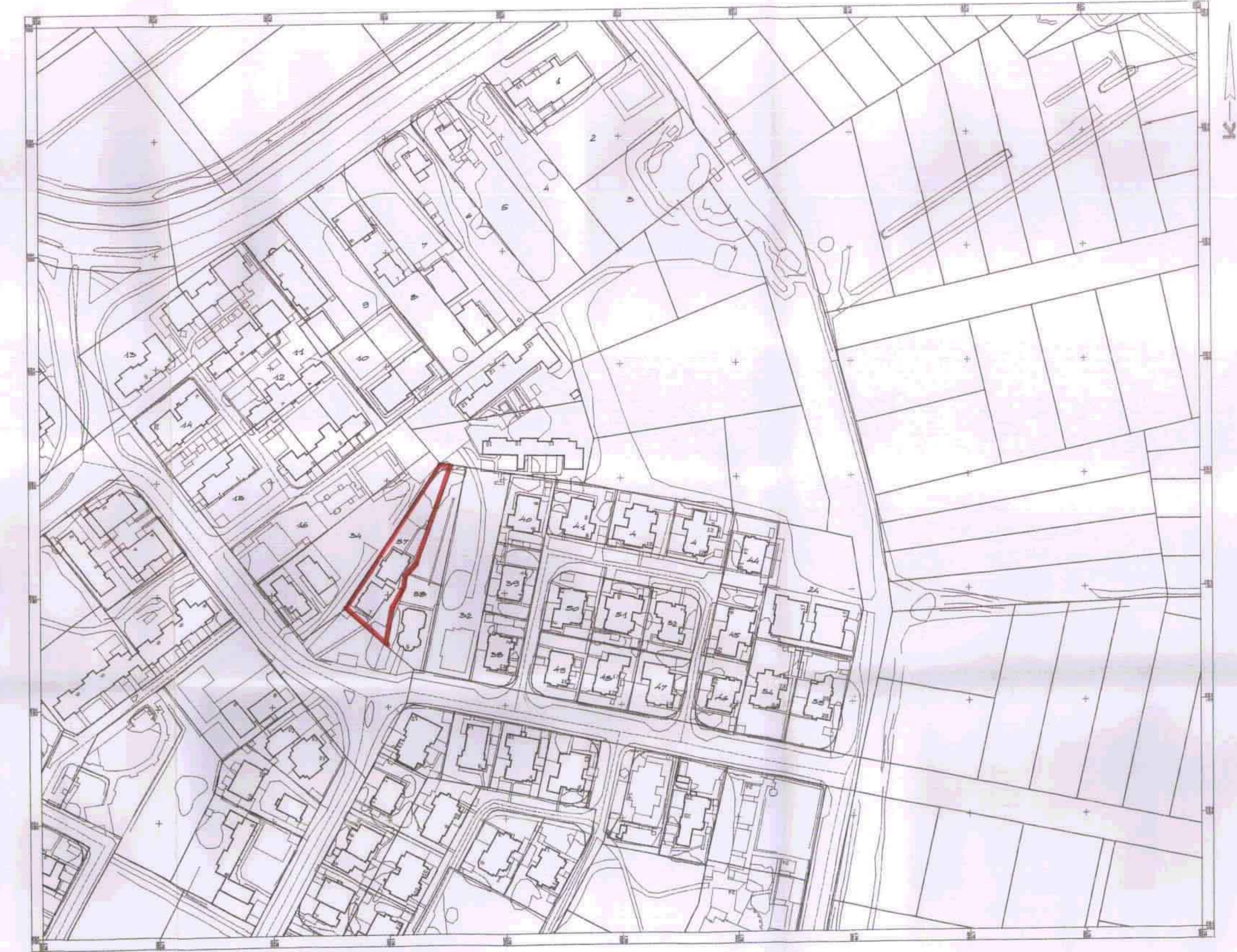
תרשים סכ"מ 1:4250