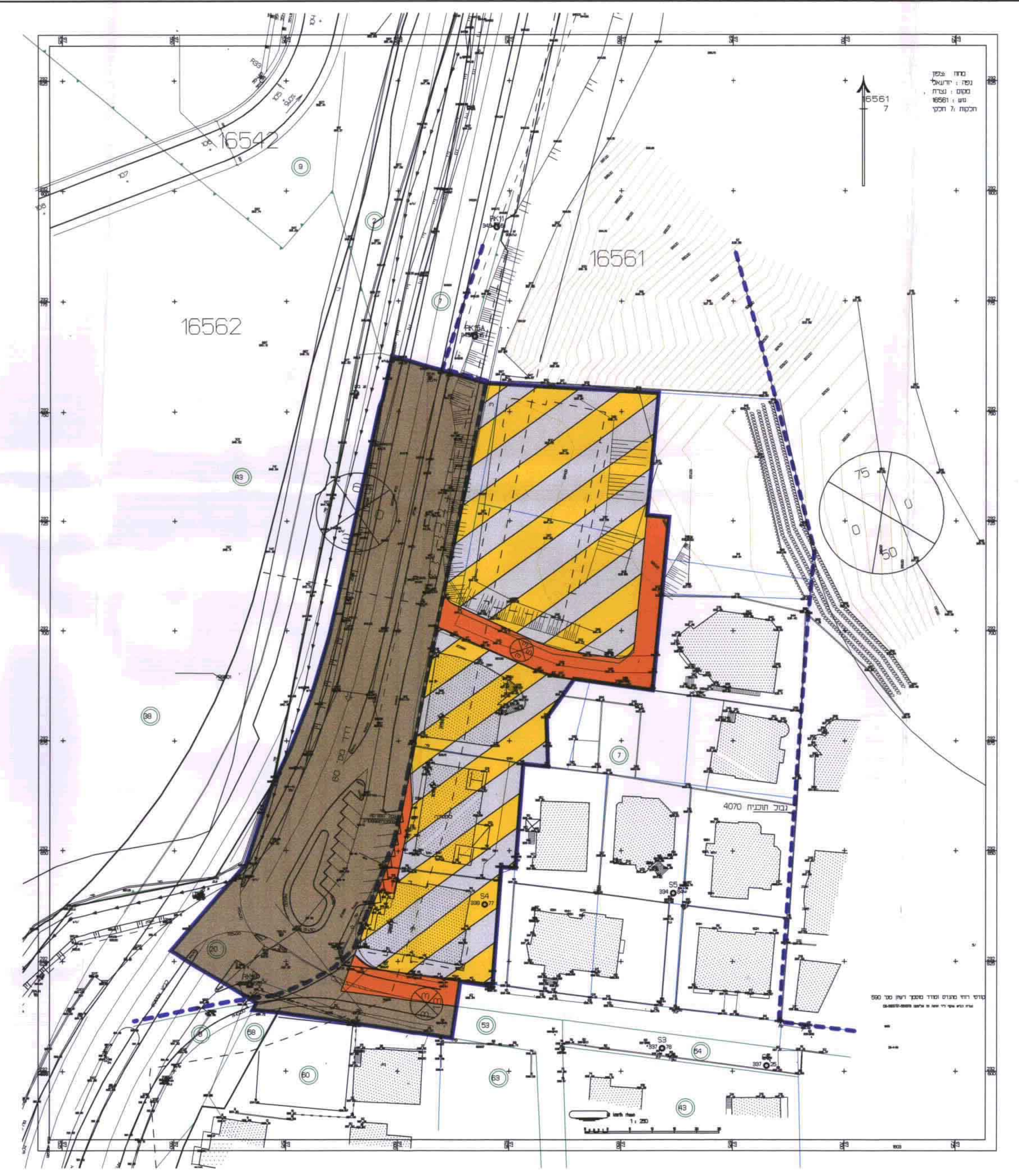
מצב מוצע ק.מ. 1:500