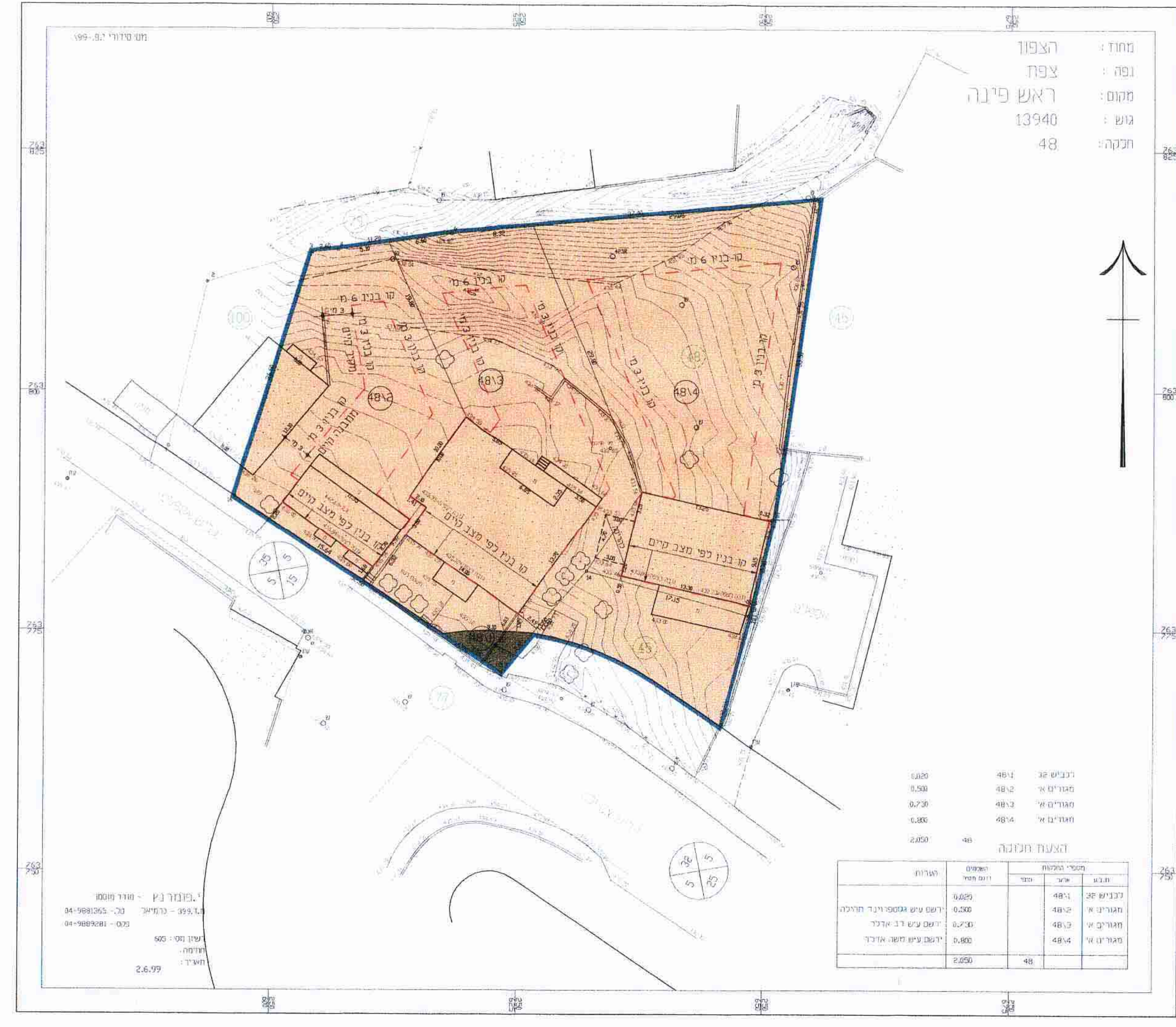
מצב מוצע ק.מ. 1-250