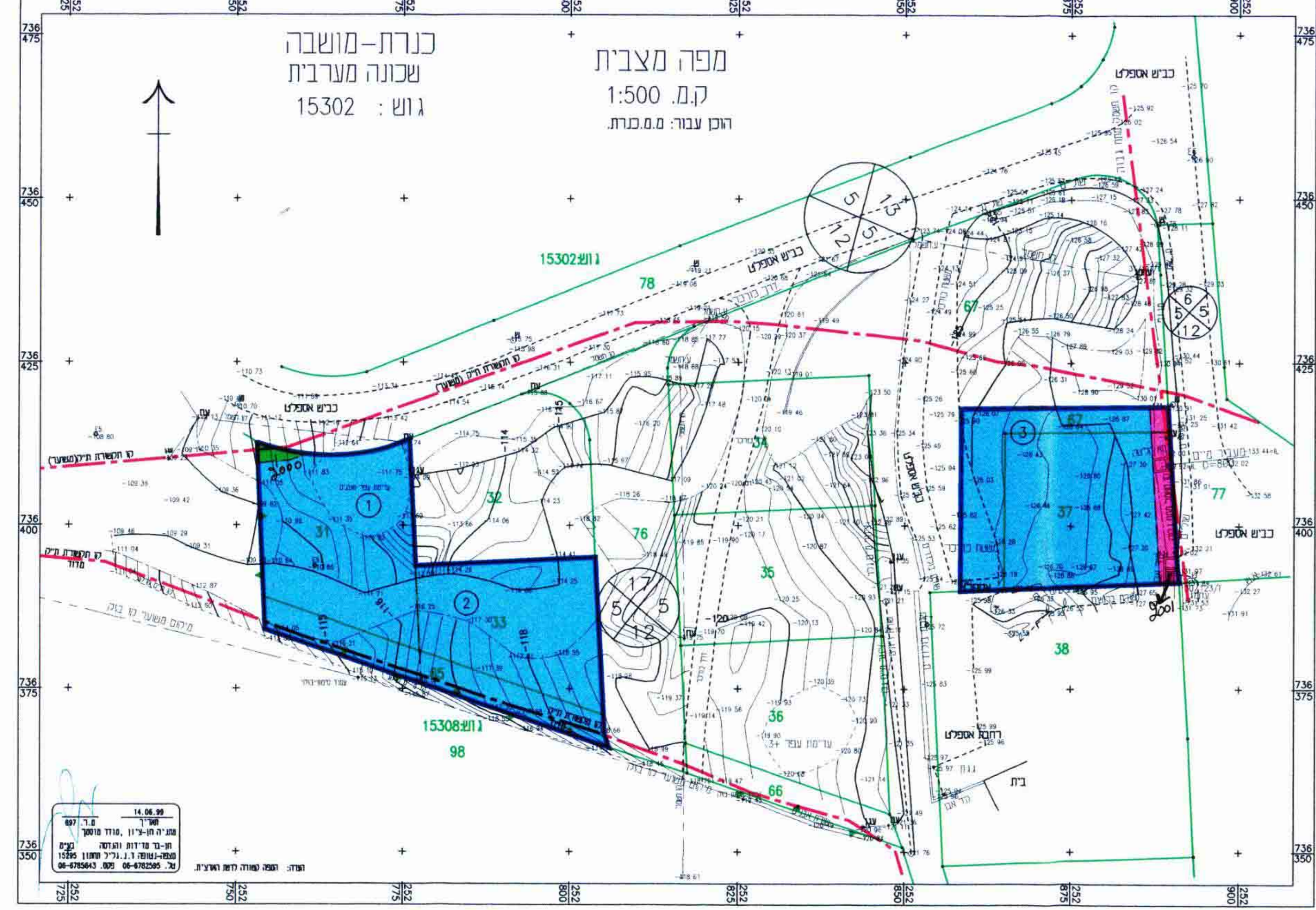
תכנית מצב מוצע ק"מ 1:500