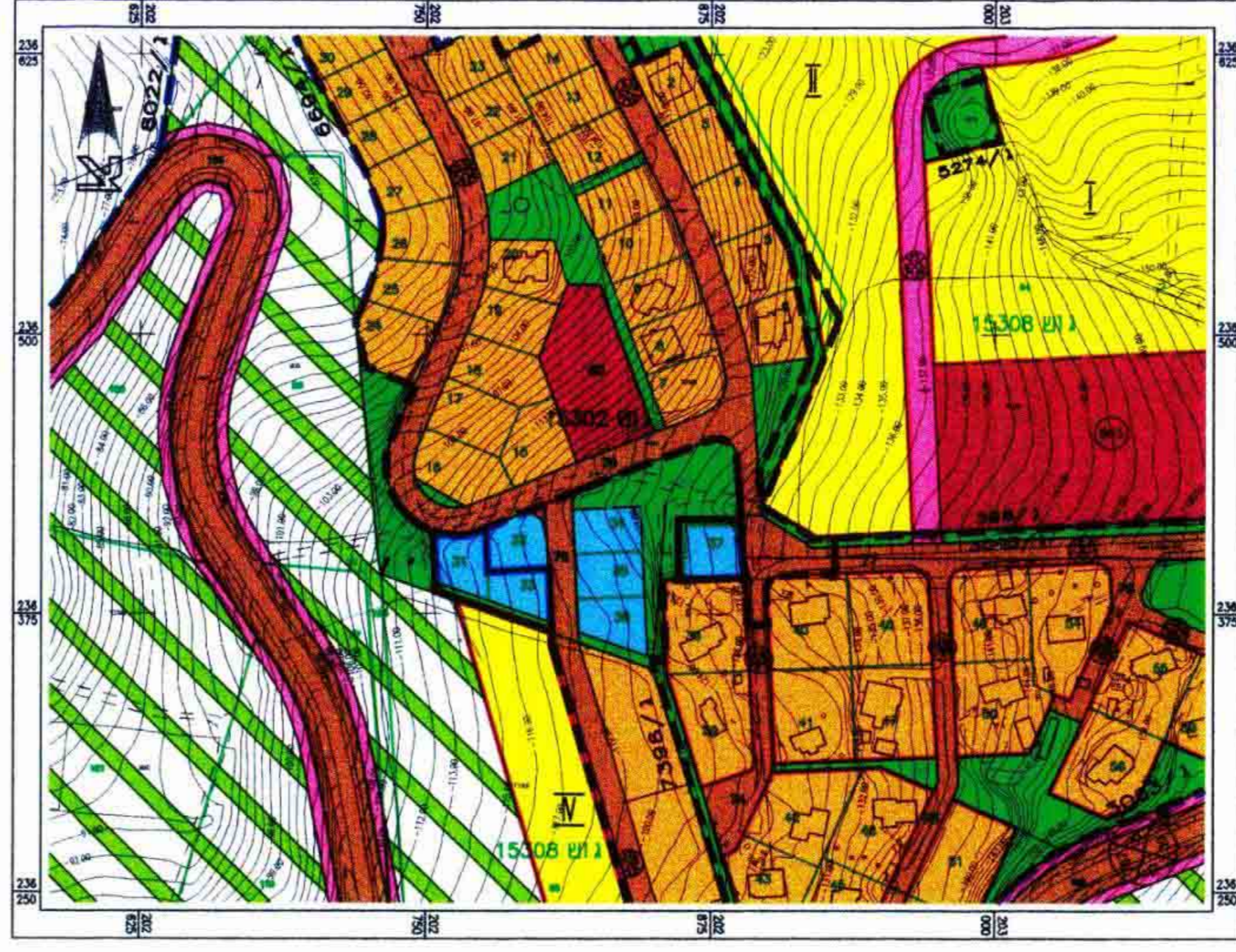
תכנית טביבה מ"פ ג' 8022/ג' (בהתקנה) ק"מ 1:2500