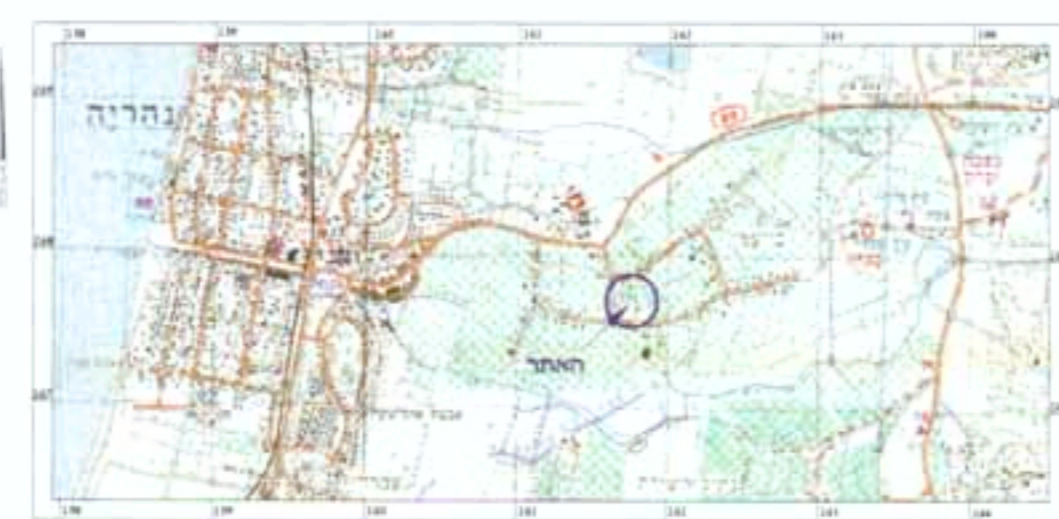
תרשים אזור, קני"מ 1:50,000