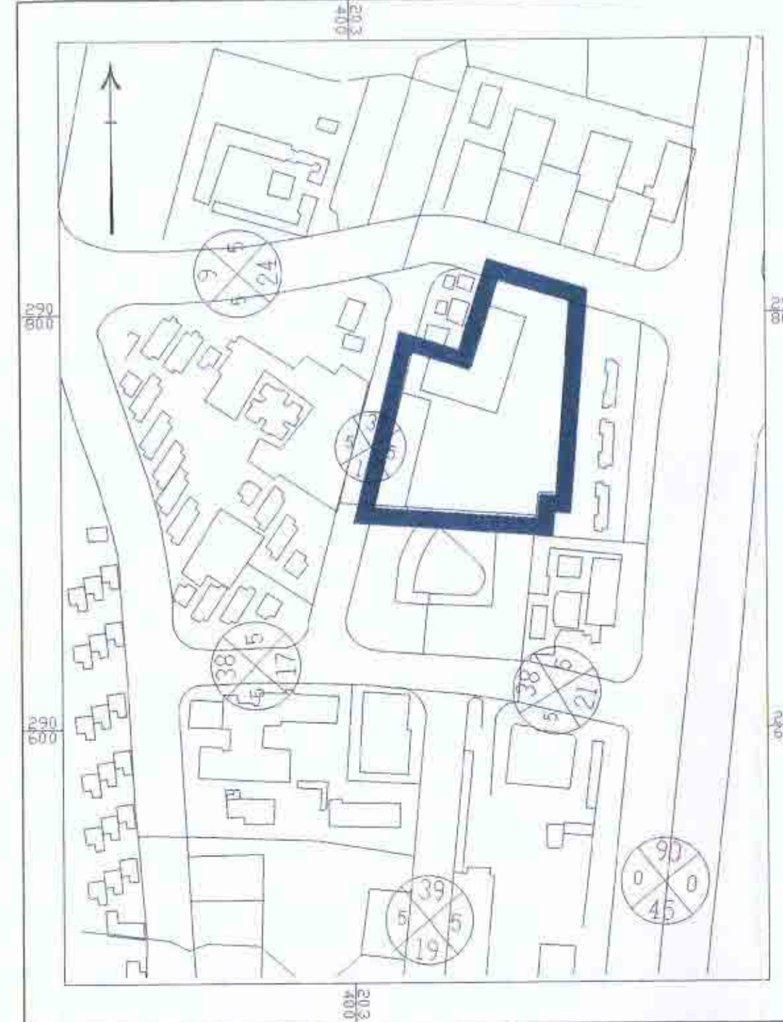
תרשים סביבה קנ"מ 1:2500 לפי תכנית 7115/ג