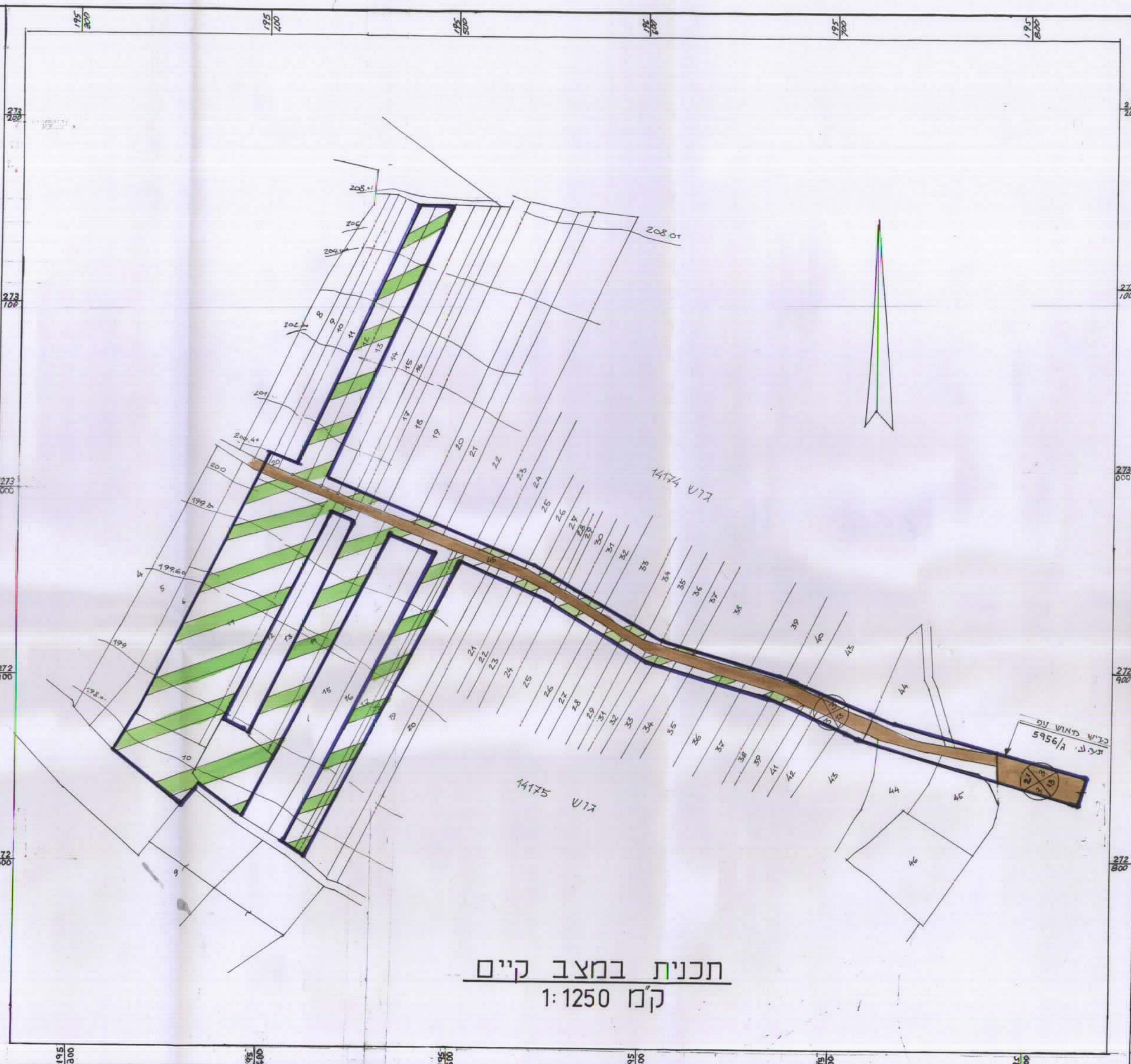
תכנית במצב קיים ק"מ 1:1250