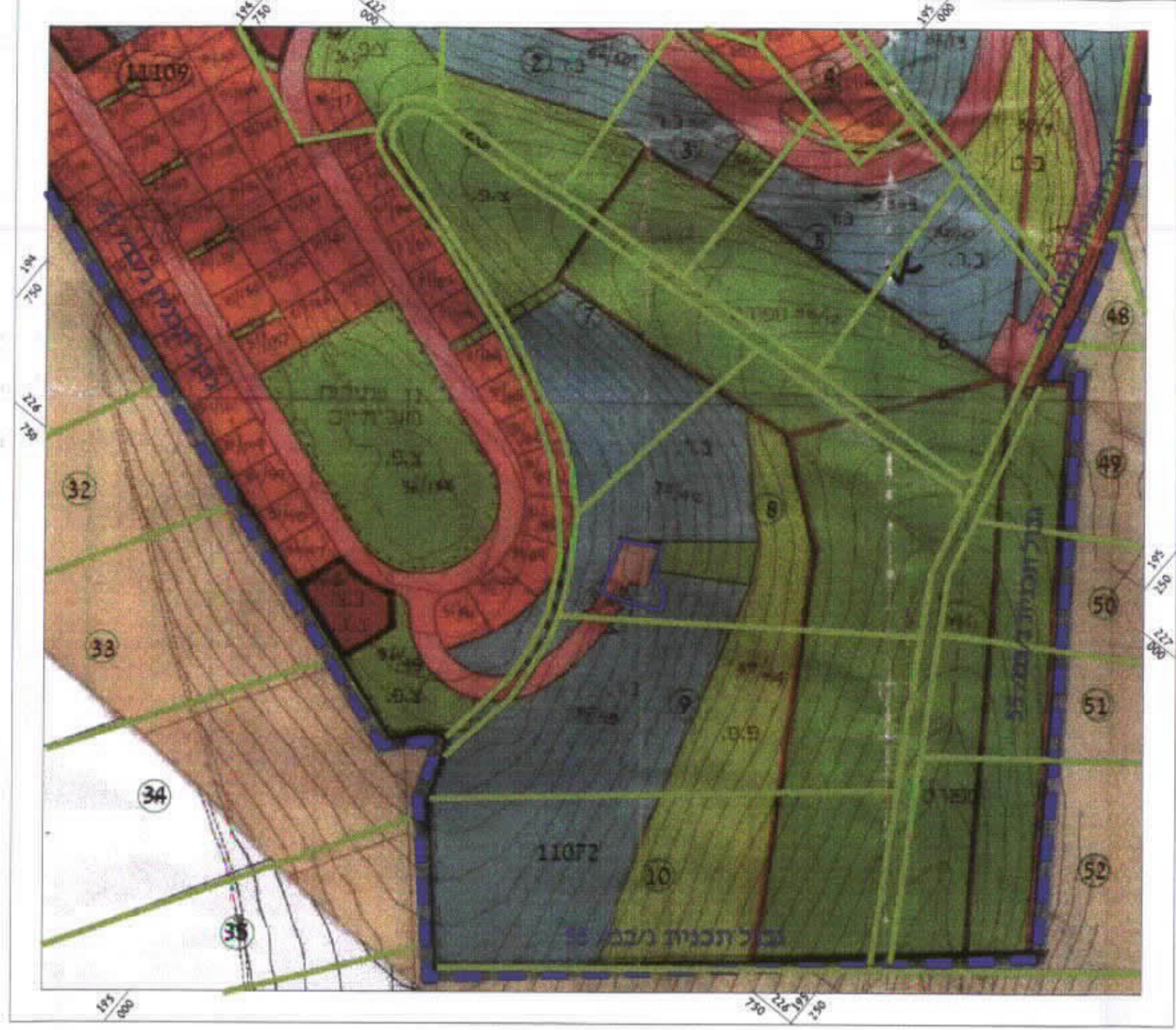
תרשים סביבה, קנ"מ 1:2,500