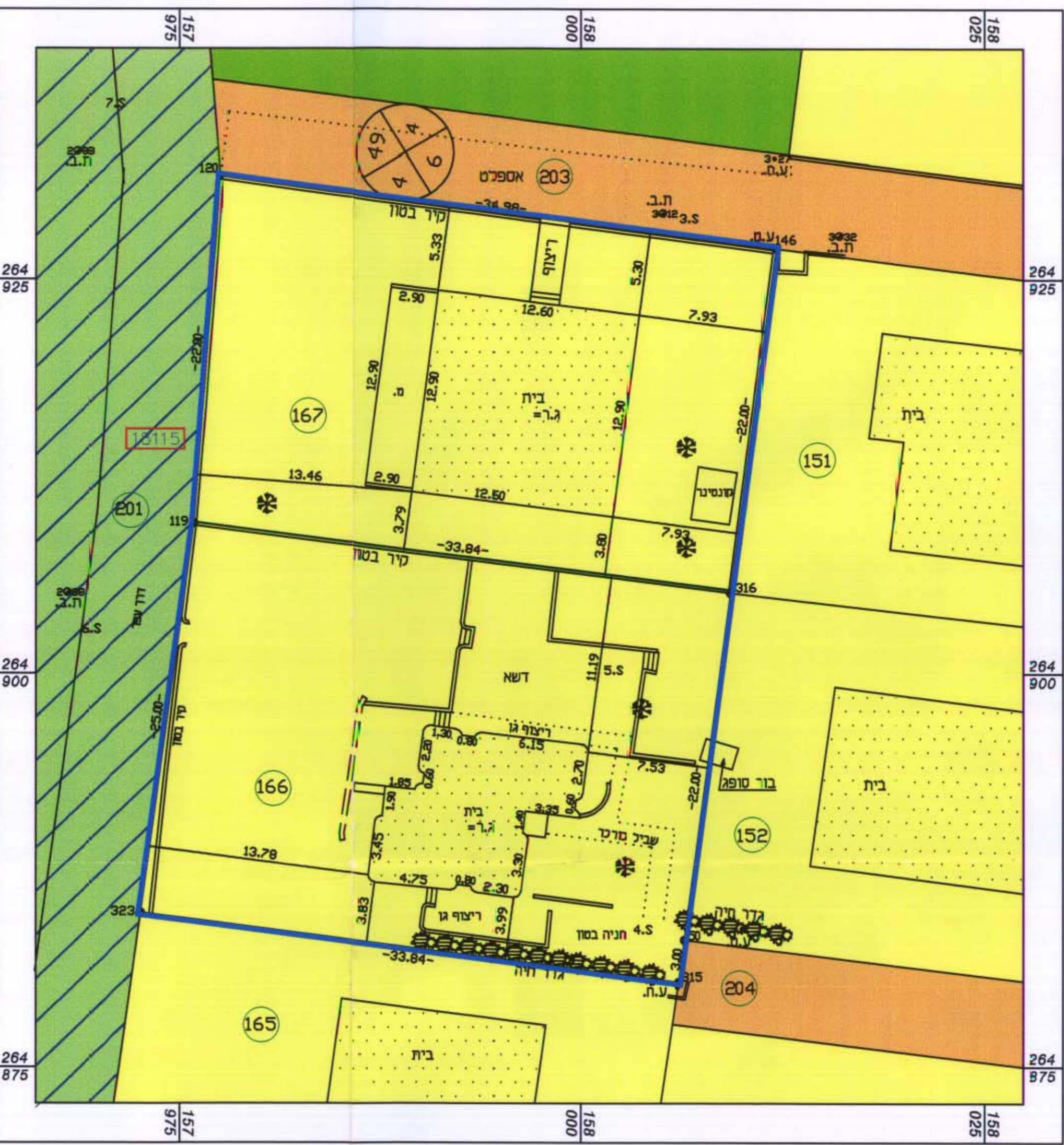
מצב מאושר ק.ת. 1:250