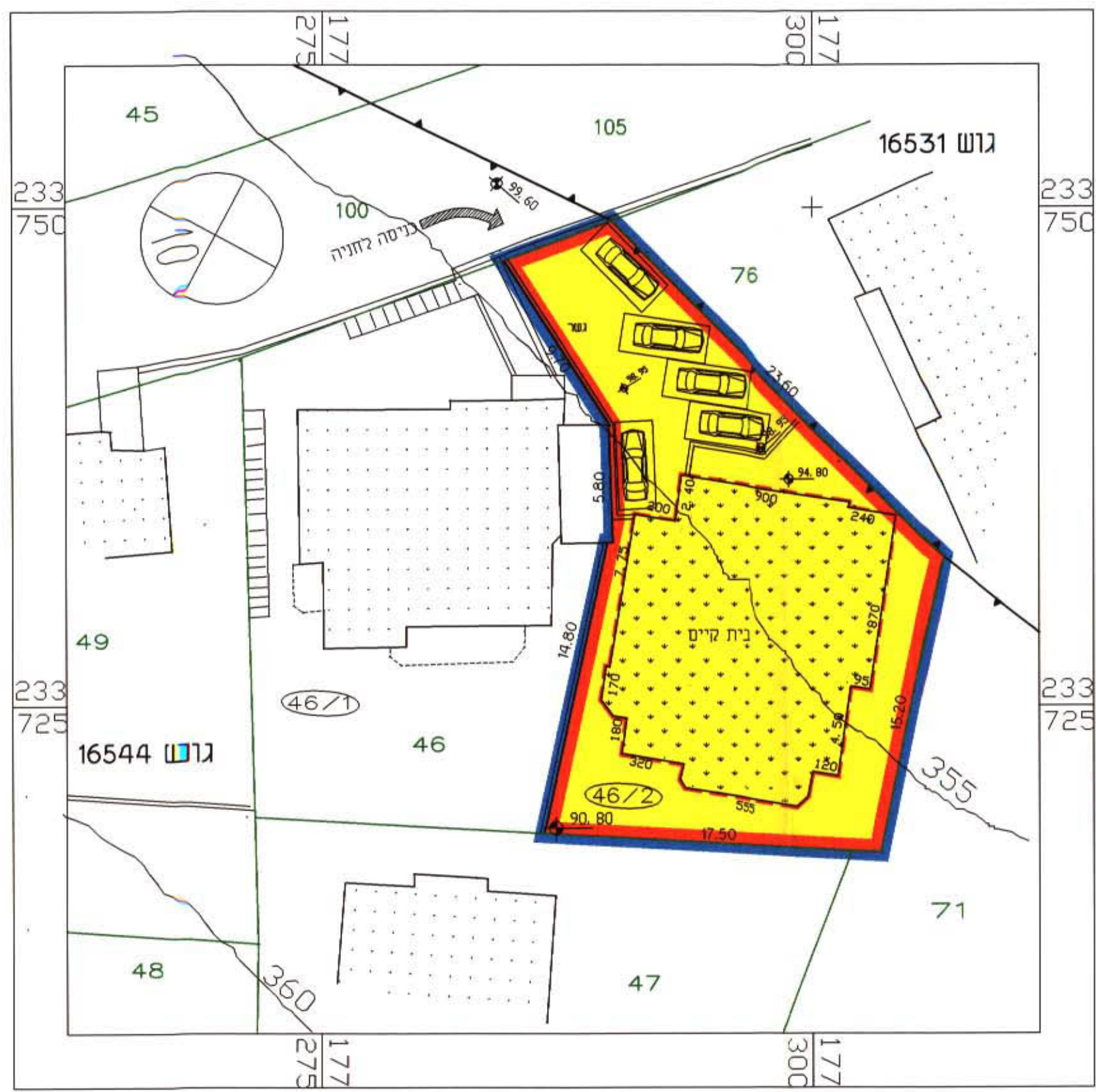
תשריט מצב מוצע קנ"מ 1:250