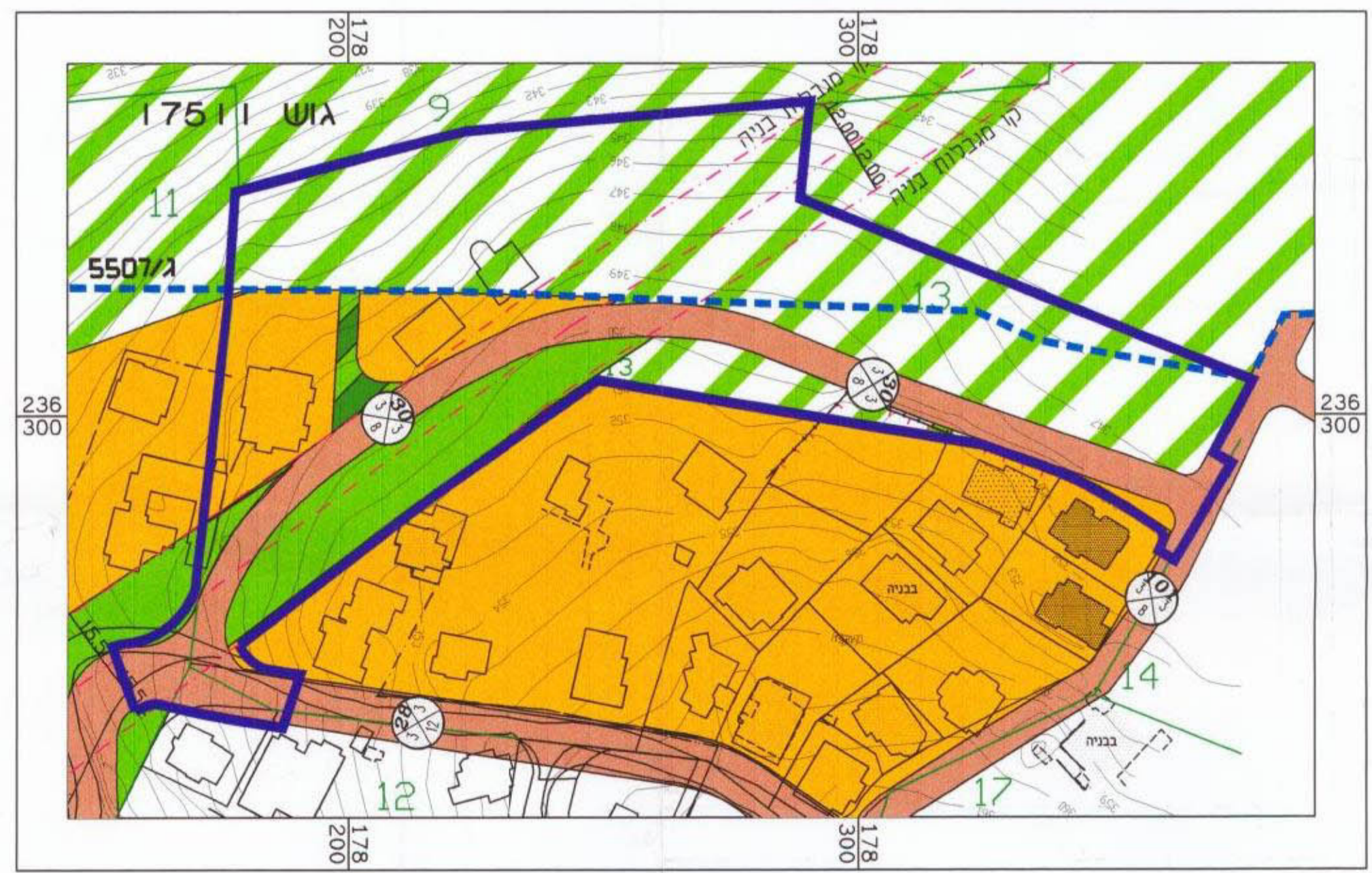
תשריט מצב קיים קנ"מ 1:1250