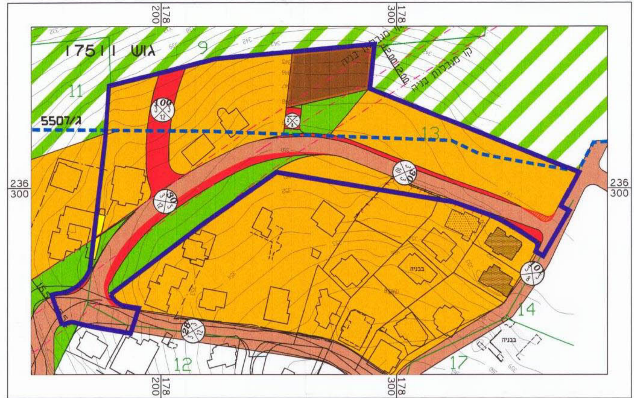
תשריט מצב מוצע קנ"מ 1:1250