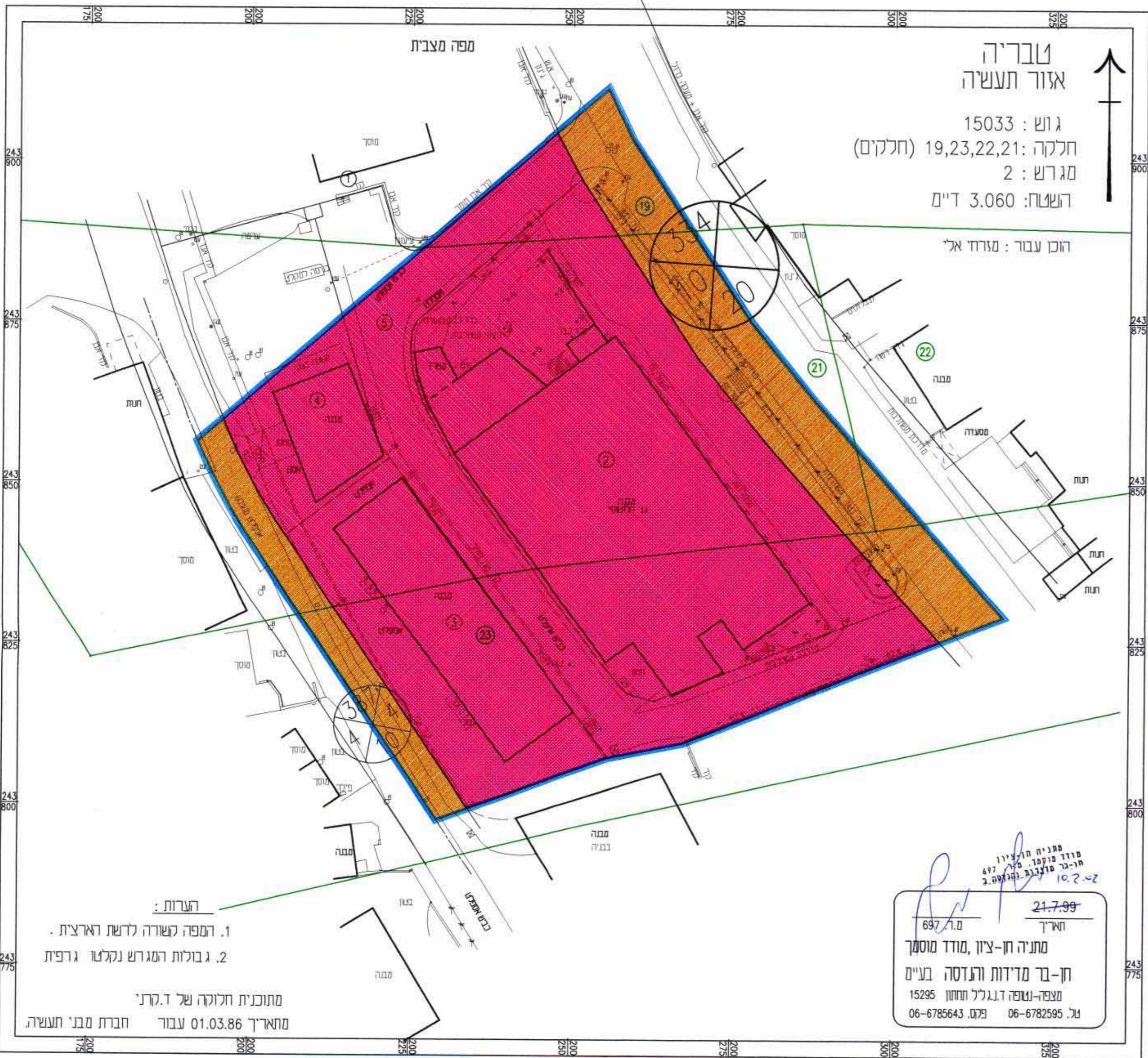
מצב קיים - קנ"מ: 1:500