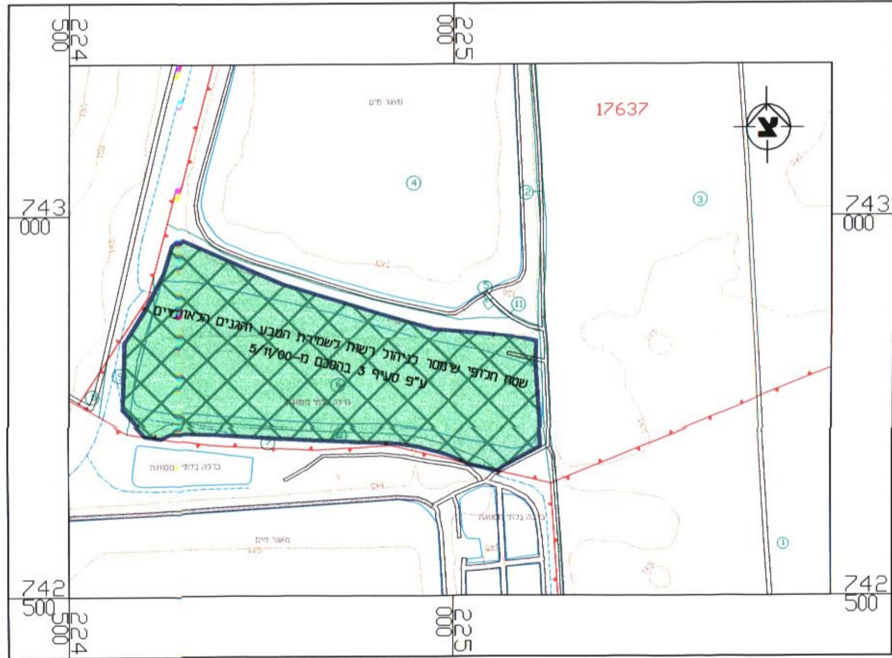
קב"ת 1 : 5,000