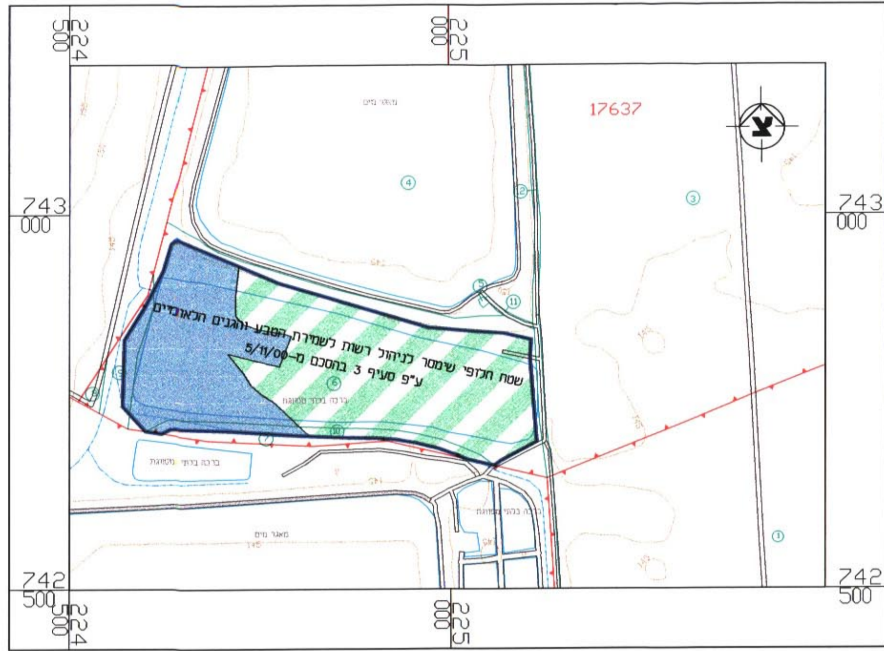
קב"ת 1 : 5,000