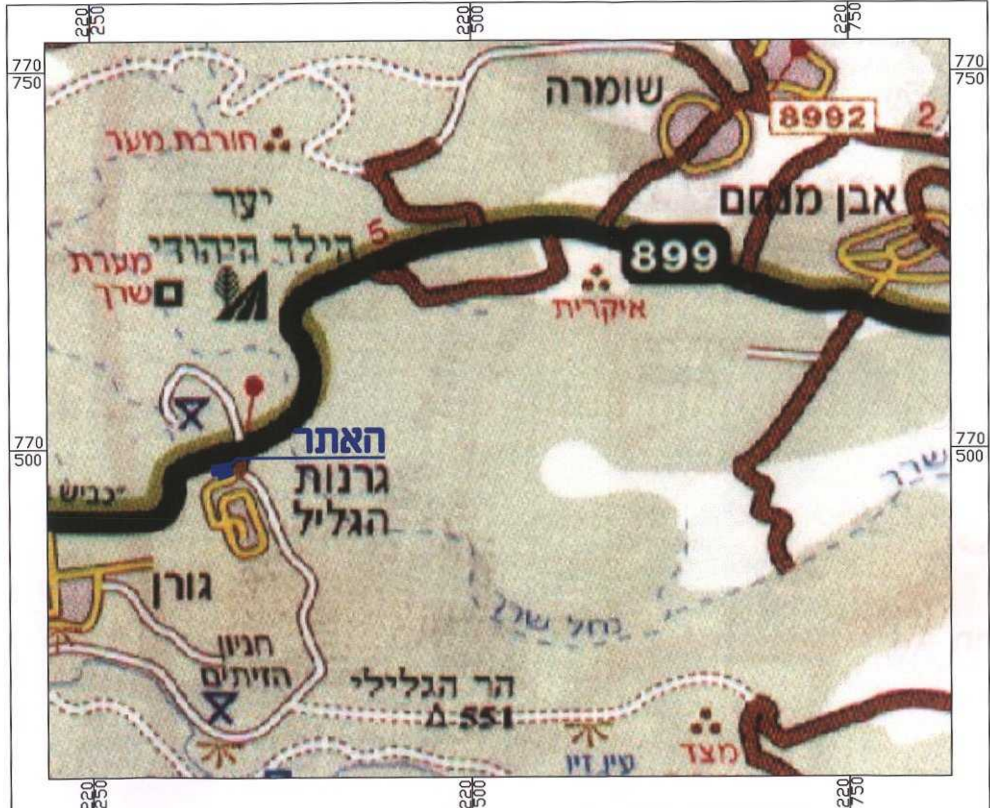
תרשים סביבה קנ"מ 1:25000

ועדה מקומית מעלה הגליל הפקדת תכנית מס 37- הועדה המקומית החליטה להסיר את התכנית בשיעור מס 9/2000 ביום 31.10.02