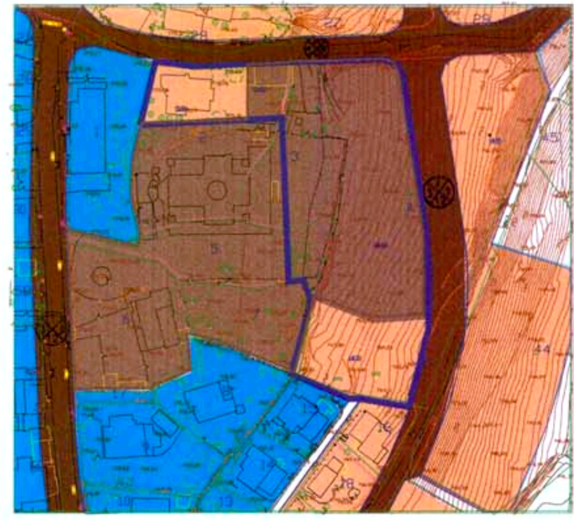
תרשים הסביבה קנה 1:10000