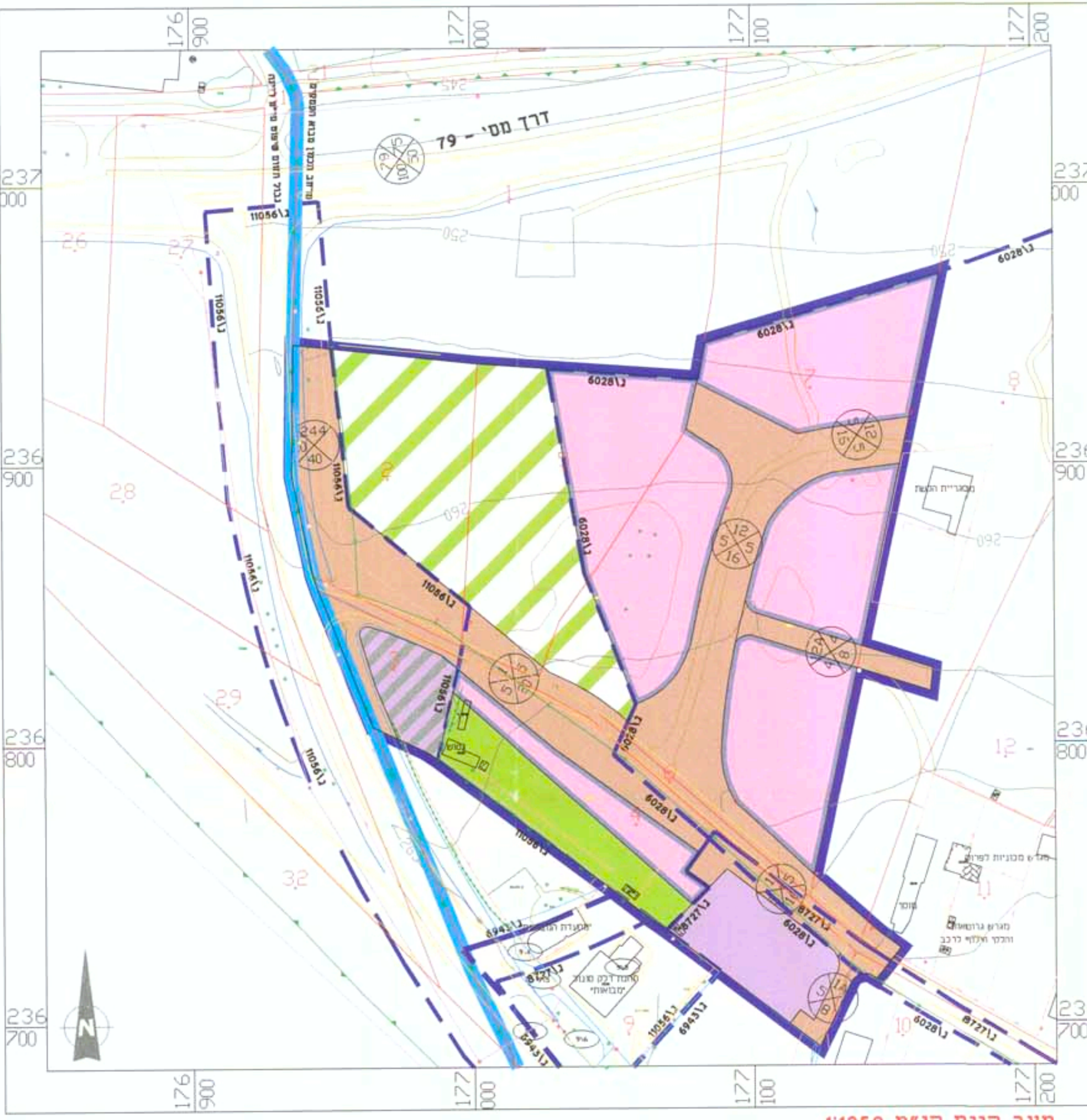
מצב קיים קנ"מ 1:1250