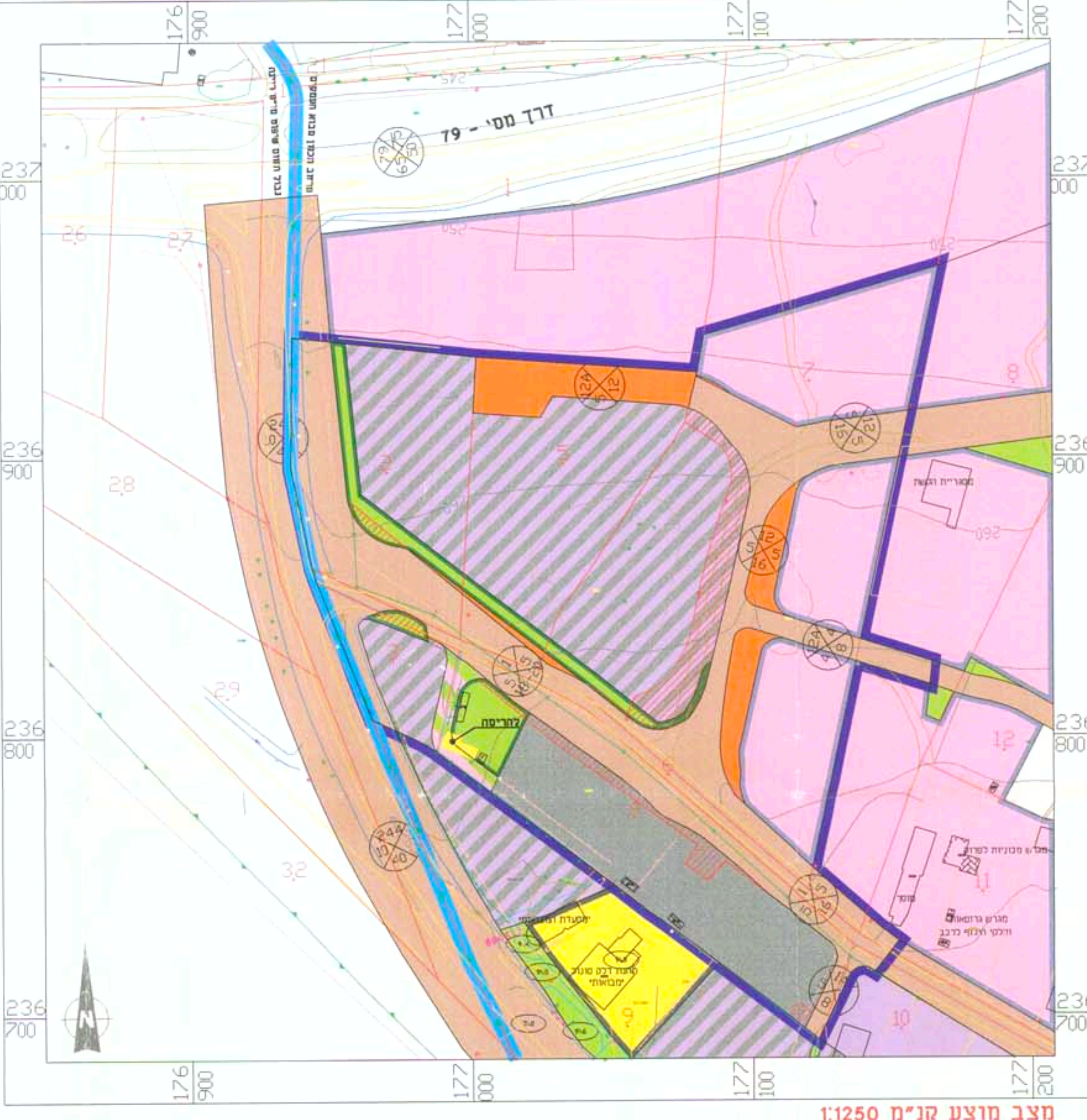
מצב מוצע קנ"מ 1:1250