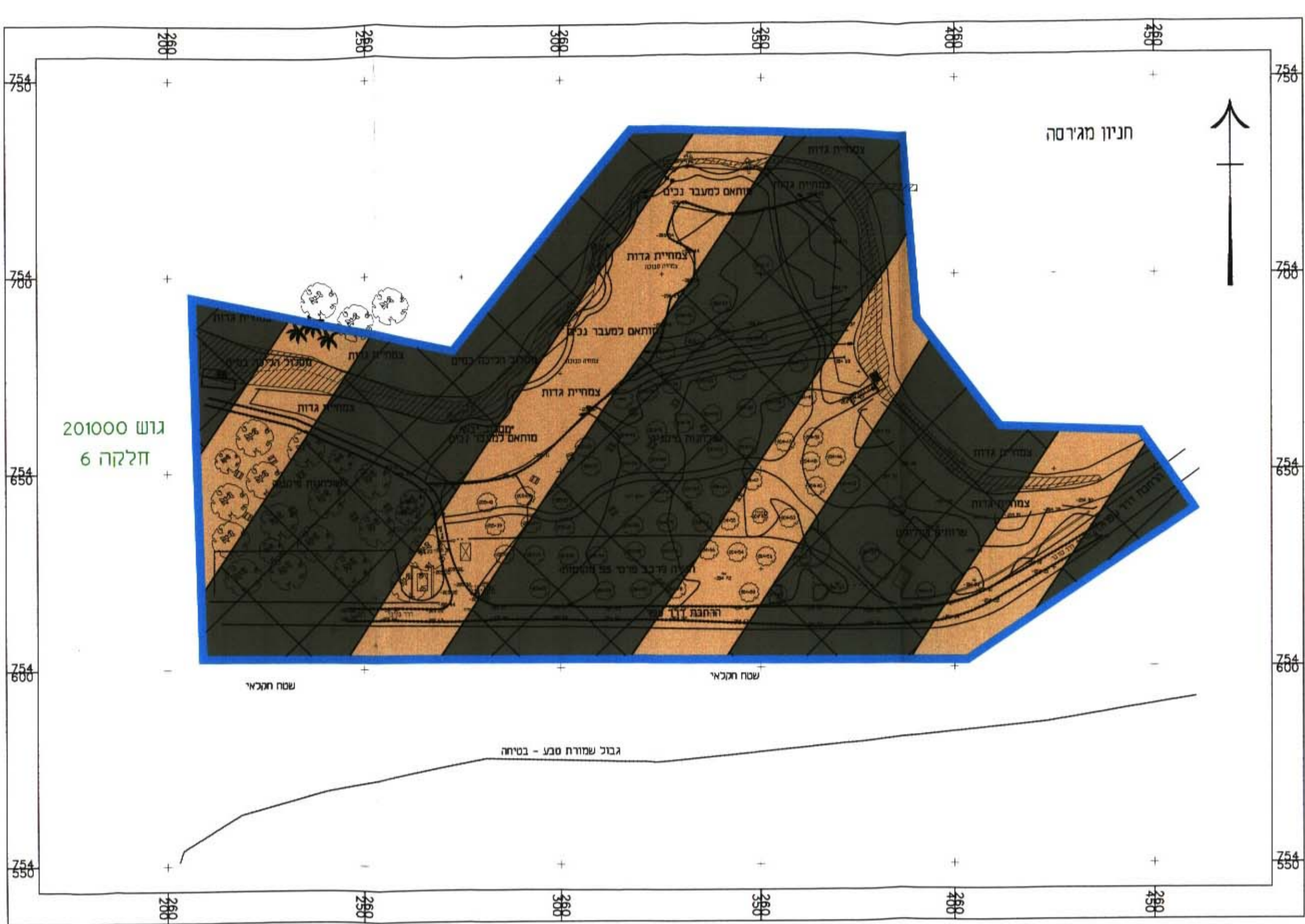
מצב מוצע קנ"מ: 1:1000