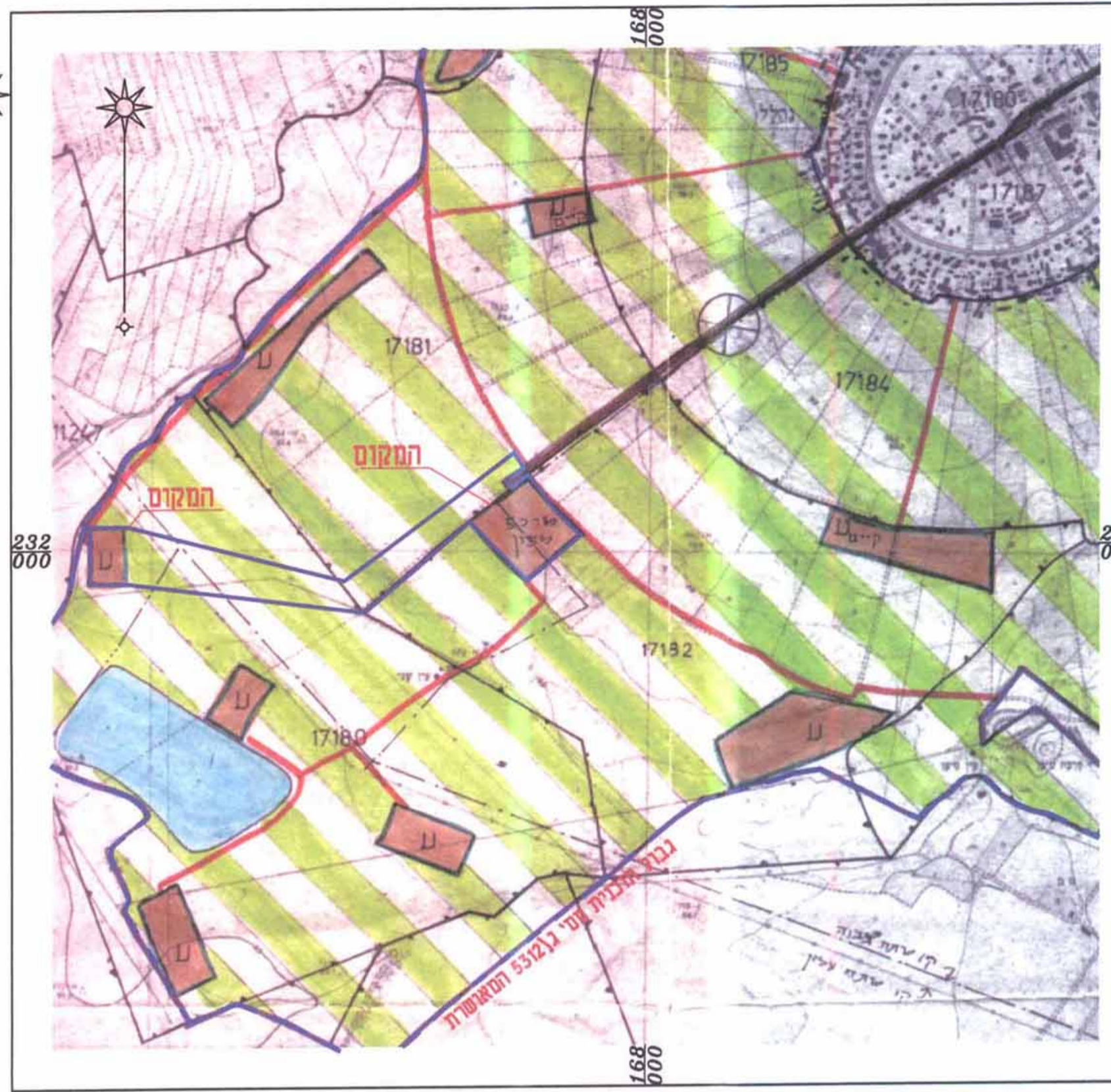
תשיים סביבה קנימ 1:10000 ברואם לתוכנית מס' ג/5312 נהלל

רמזי קעואר מודד מוסמך מ.ר. 883 רח אימותני 22 חיפה טל 04-8524038 052-352708 תאריך 07.09.05 חתימה האדריכל