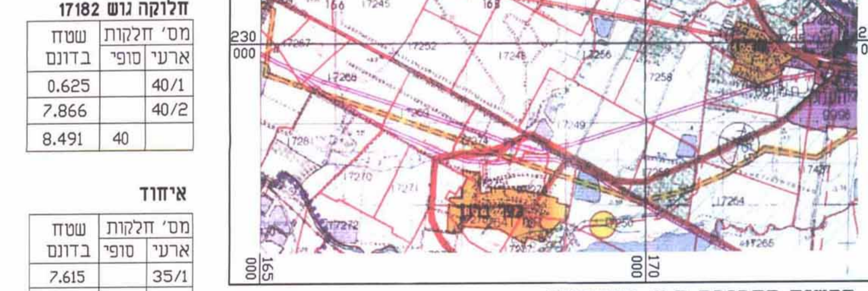
תשיים הסביבה ק.מ. 1:500000 (לפי תוכנית תחום שיפוט עמק יזרעאל)