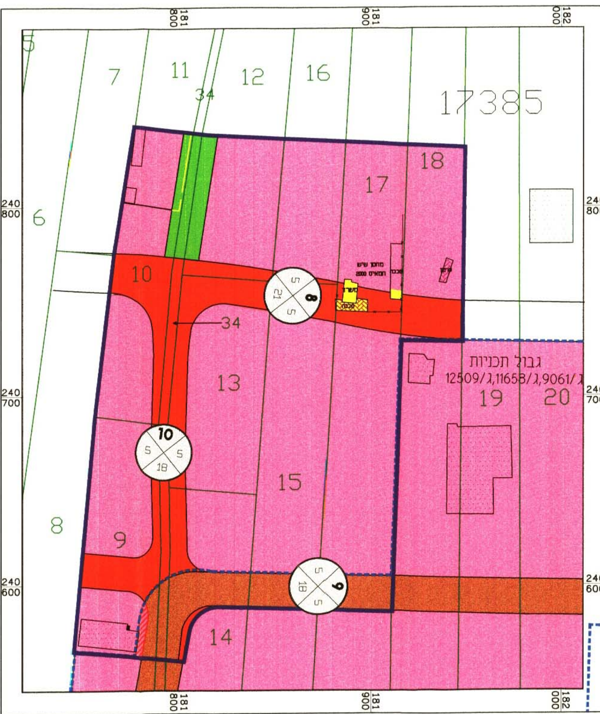
תשריט מצב מוצע קני"מ 1:1250