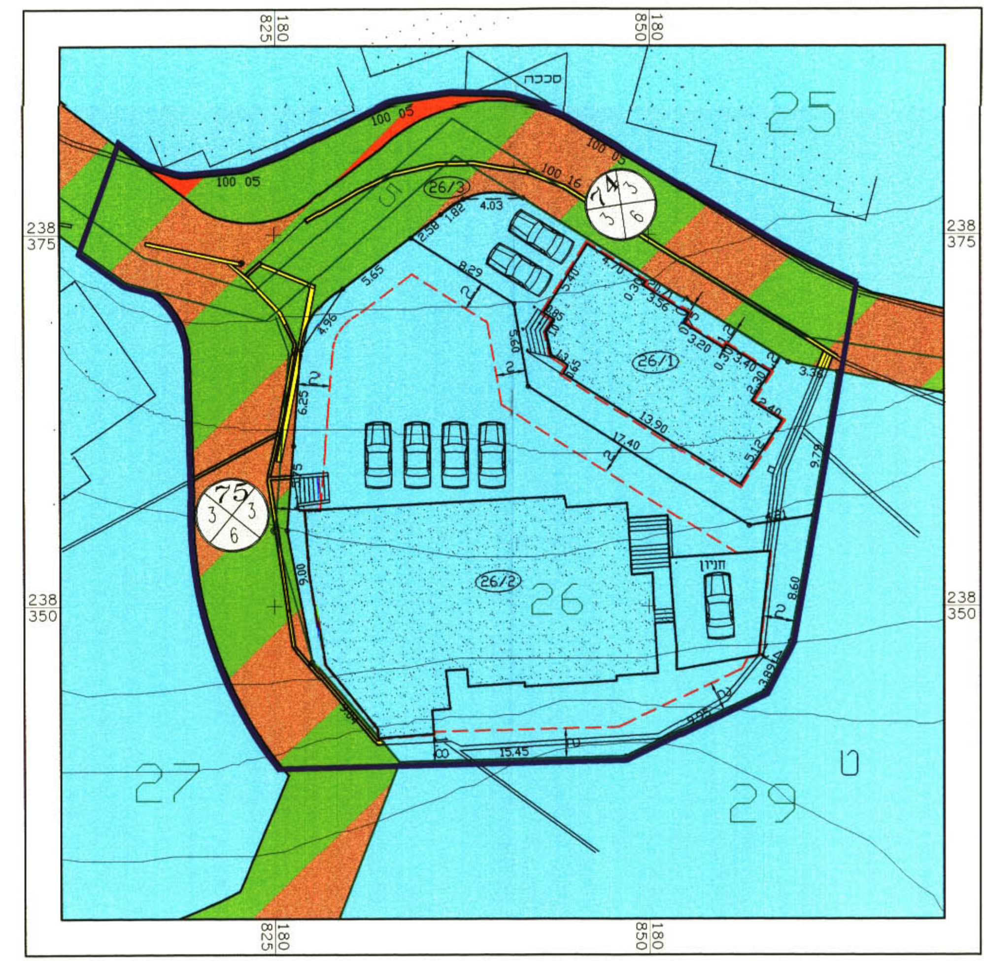
תשריט מצב מוצע קנ"מ 1:250