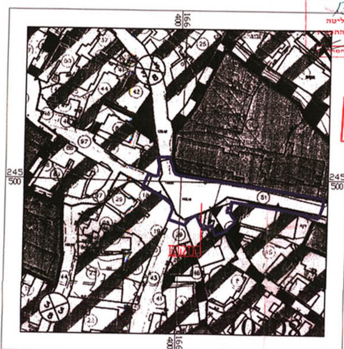
תרשים הסביבה קני"מ 1:1250 (לפי תוכנית מתאר מקומית מס' 11383/ג)