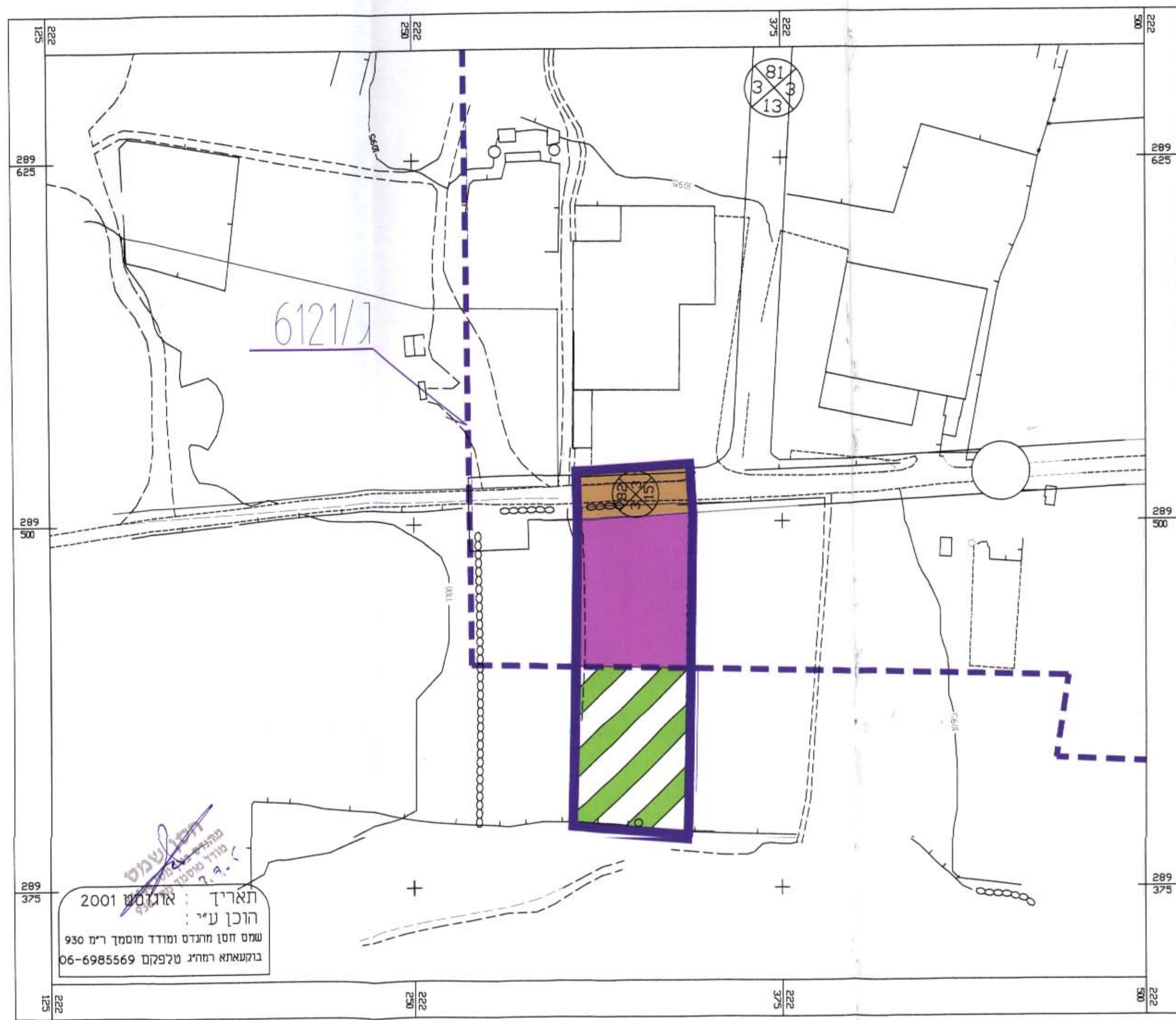
תכנית מצב קיים קנ"מ 1:1250