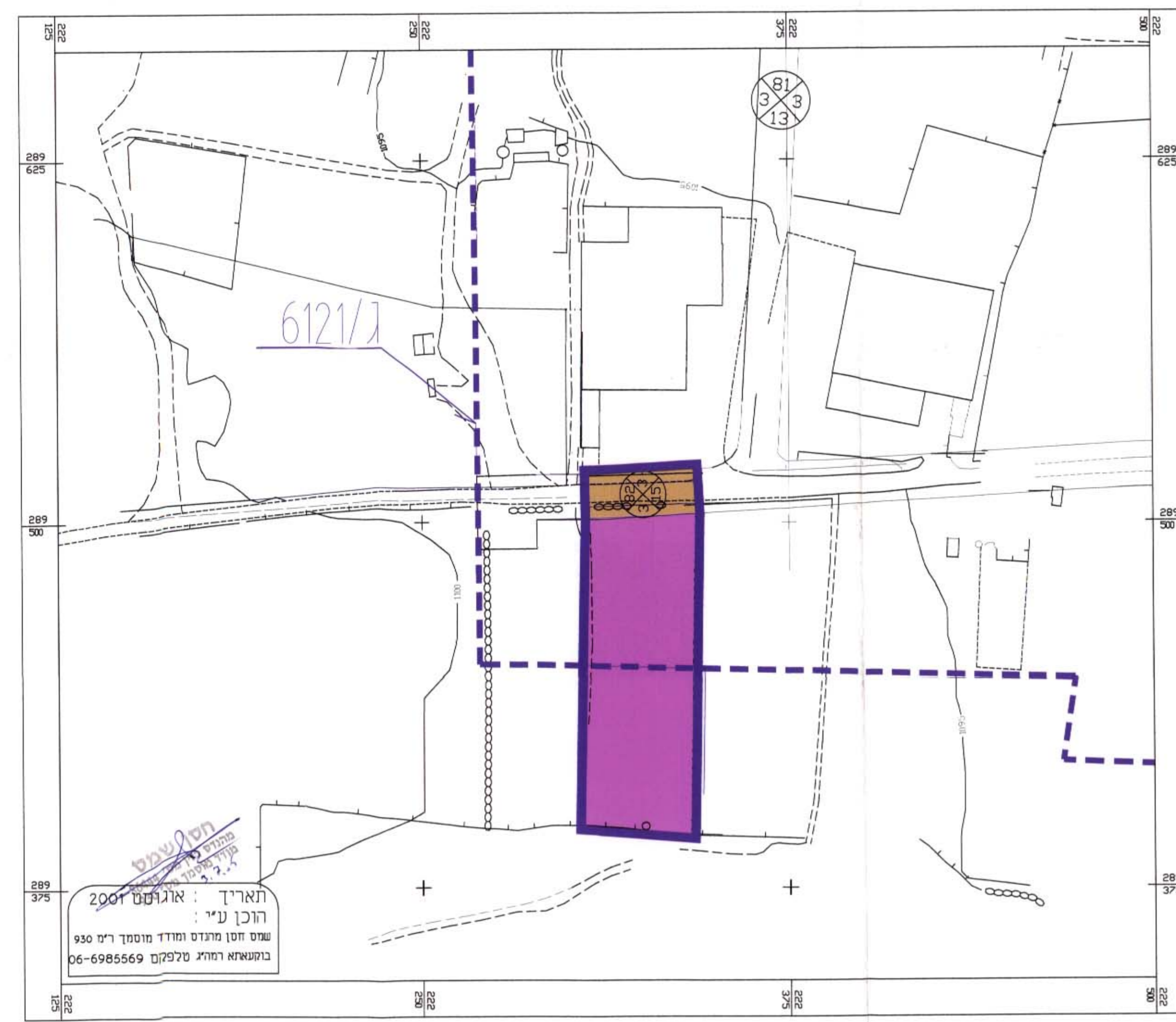
תכנית מצב מוצע קנ"מ 1:1250