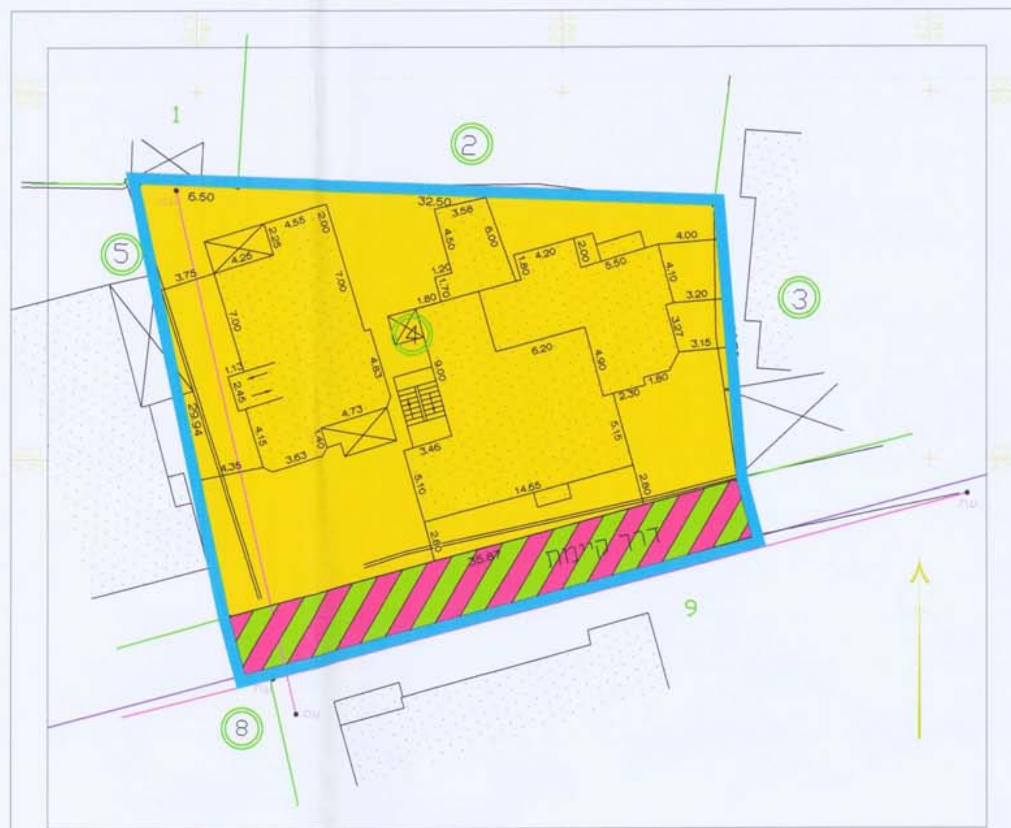
מצב קיים קנ"מ 1:500