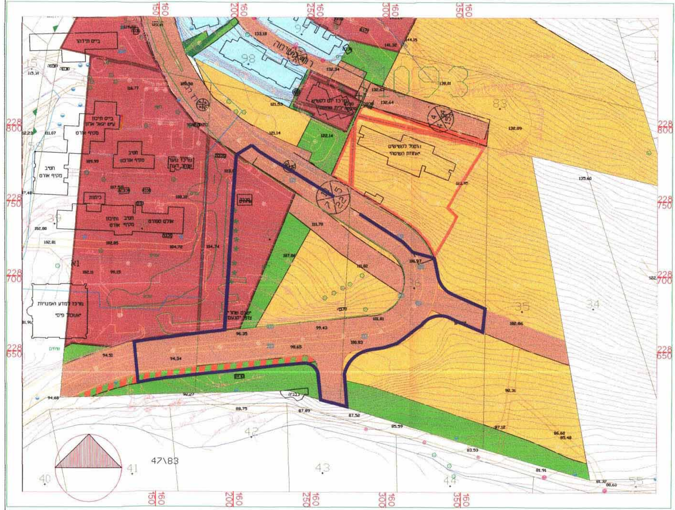
תכנית מצב קיים 1:1250