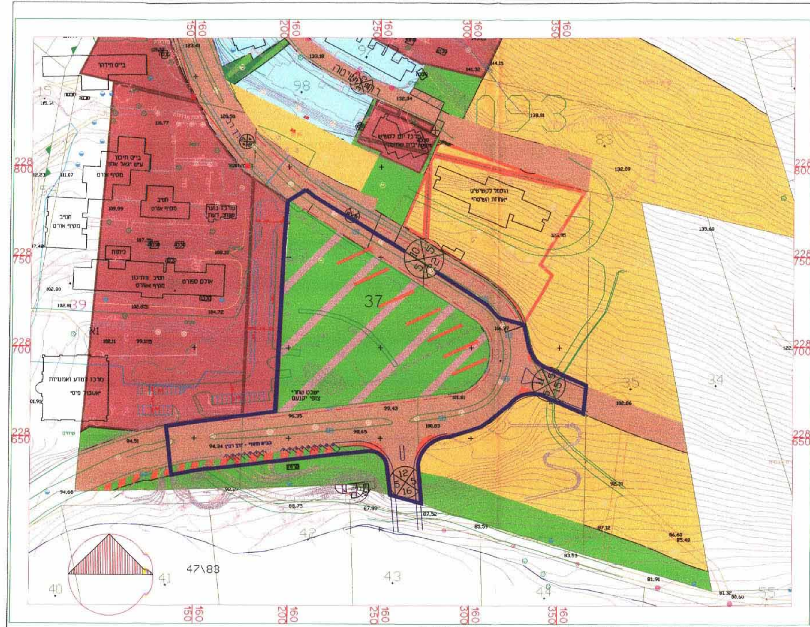
תכנית מצב מוצע 1:1250