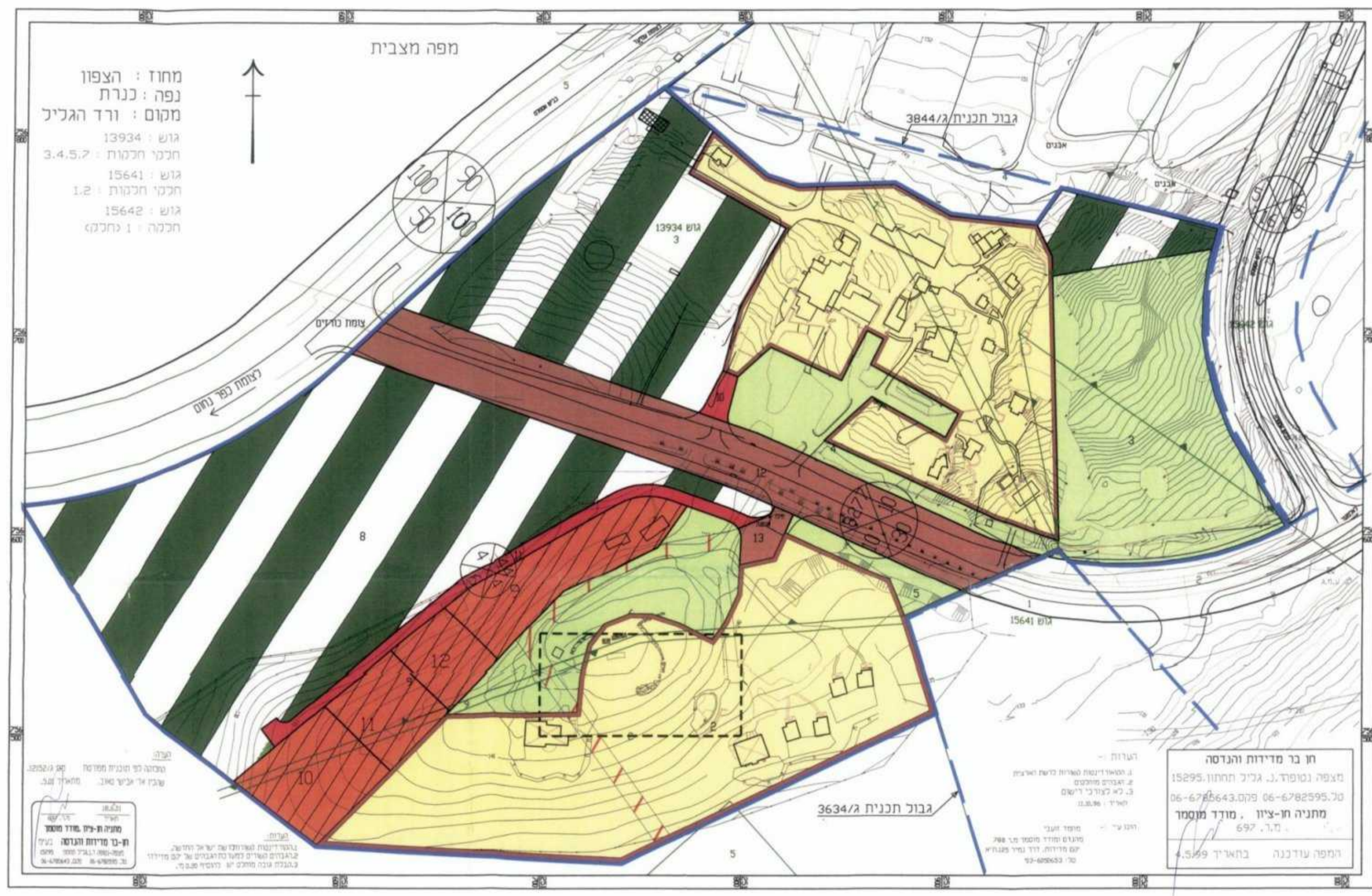
מצב מוצע קני"מ 1:1250

חתימות ואישורים אבישי טאוב תכנון אדריכלי ובינוי ערים בע"מ כוריס ד.ג. חבל כוריס טל: 04-6938468 פקס: 04-6934977 תאריך: 2/2