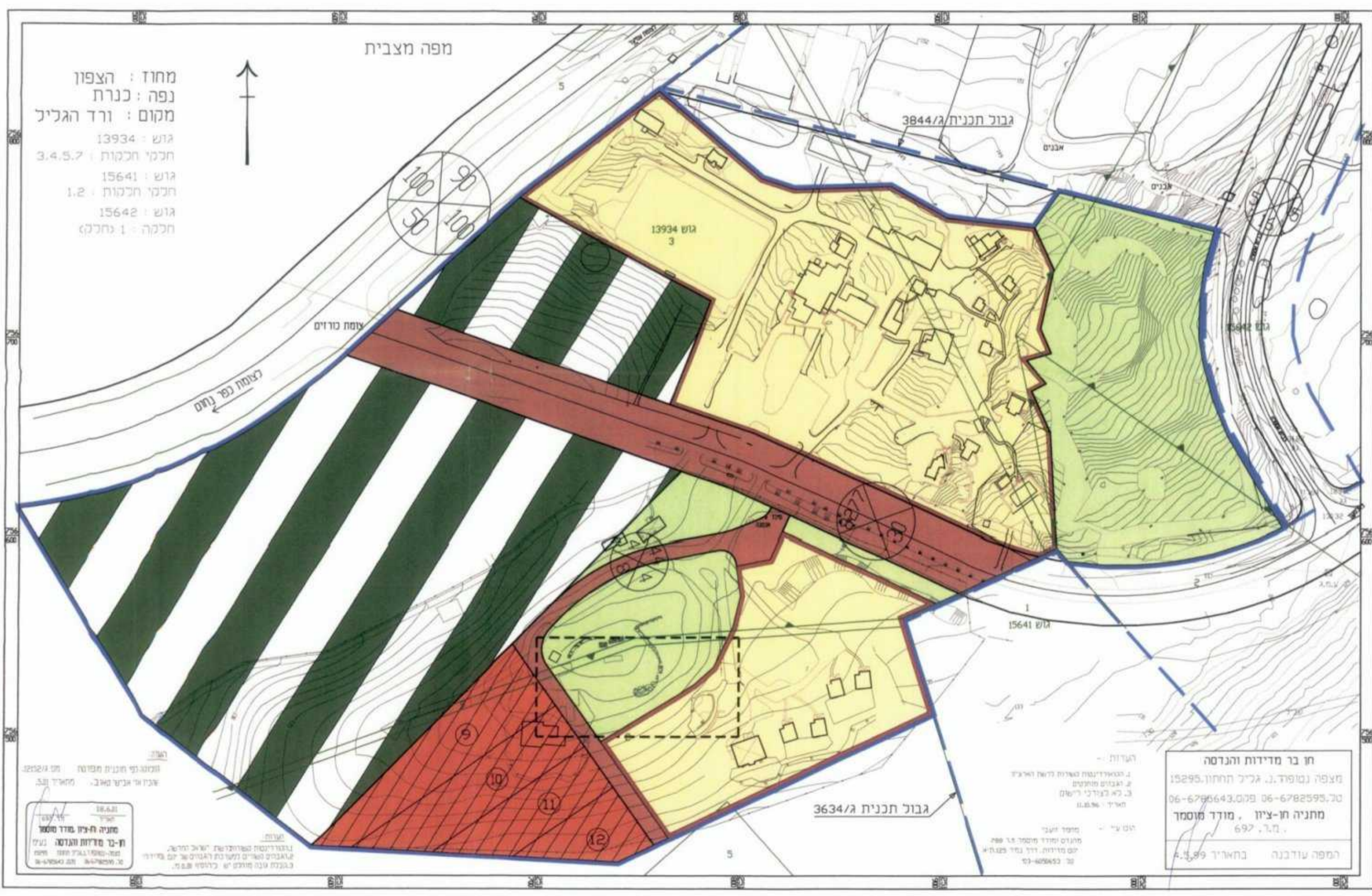
מצב קיים קני"מ 1:1250

חתימות ואישורים אבישי טאוב תכנון אדריכלי ובינוי ערים בע"מ כוריס ד.ג. חבל כוריס טל: 04-6938468 פקס: 04-6934977 תאריך: 2/2