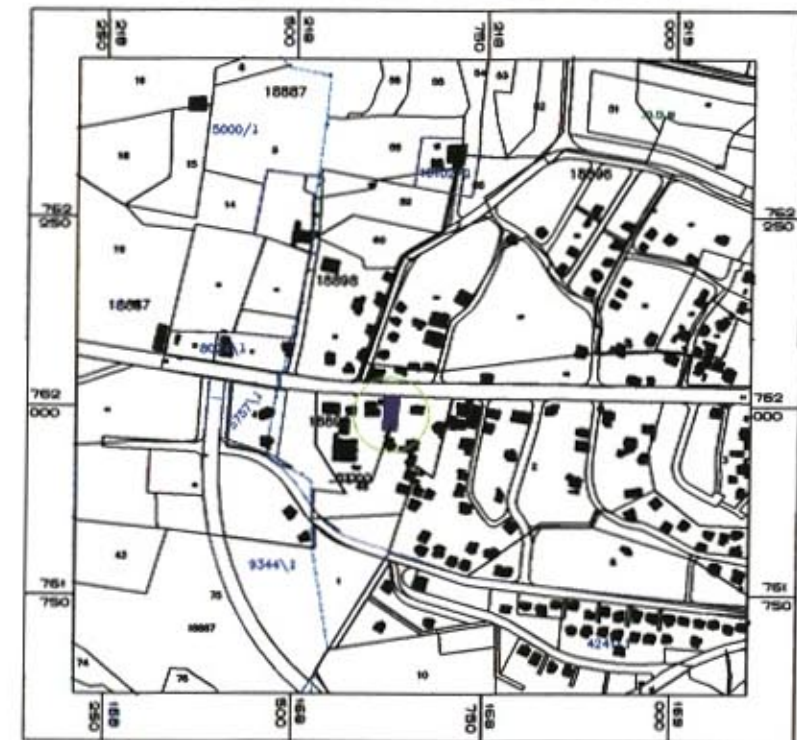
תרשים סביבה קנ"מ 1:10000