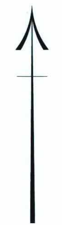
תרשים סביבה קניימ 1:10000