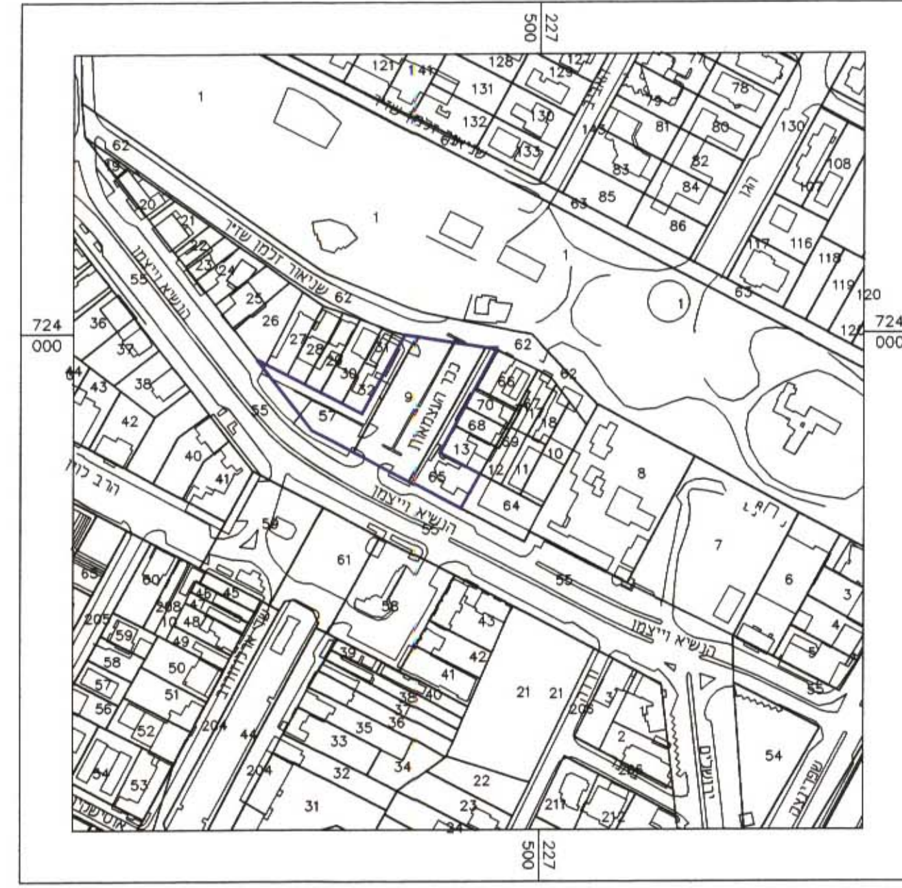
תרשים סביבה קרי"מ : 1:2500