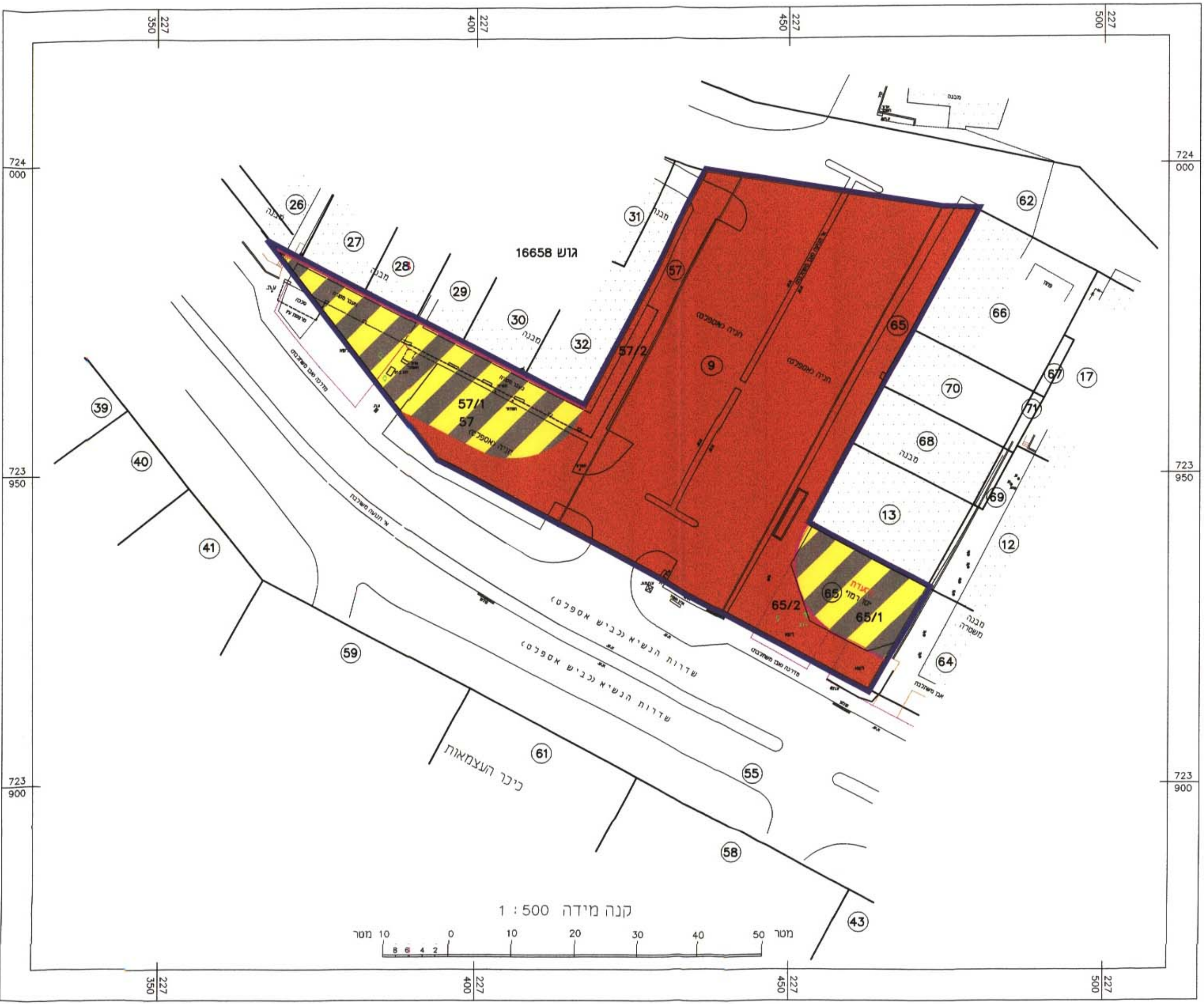
מצב קיים קרי"מ : 1:500