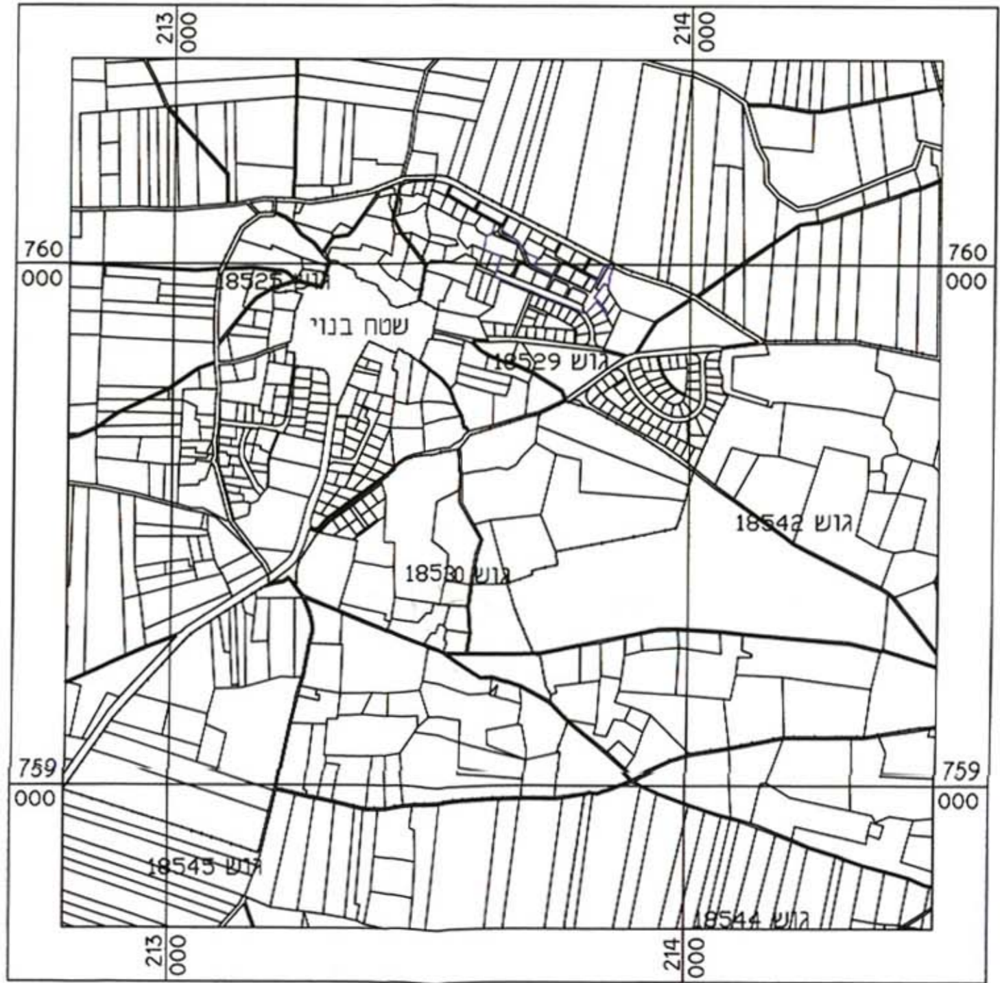
תרשים הסביבה קו"מ 1:10,000