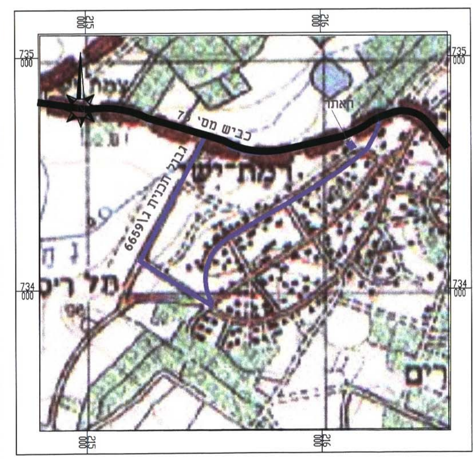
תרשים סביבה - קנ"מ 1:10,000