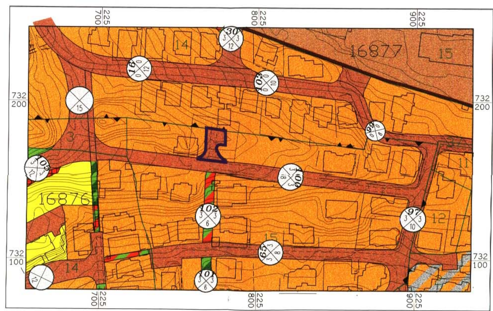
תשריט מצב מאושר קנ"מ 1:1250