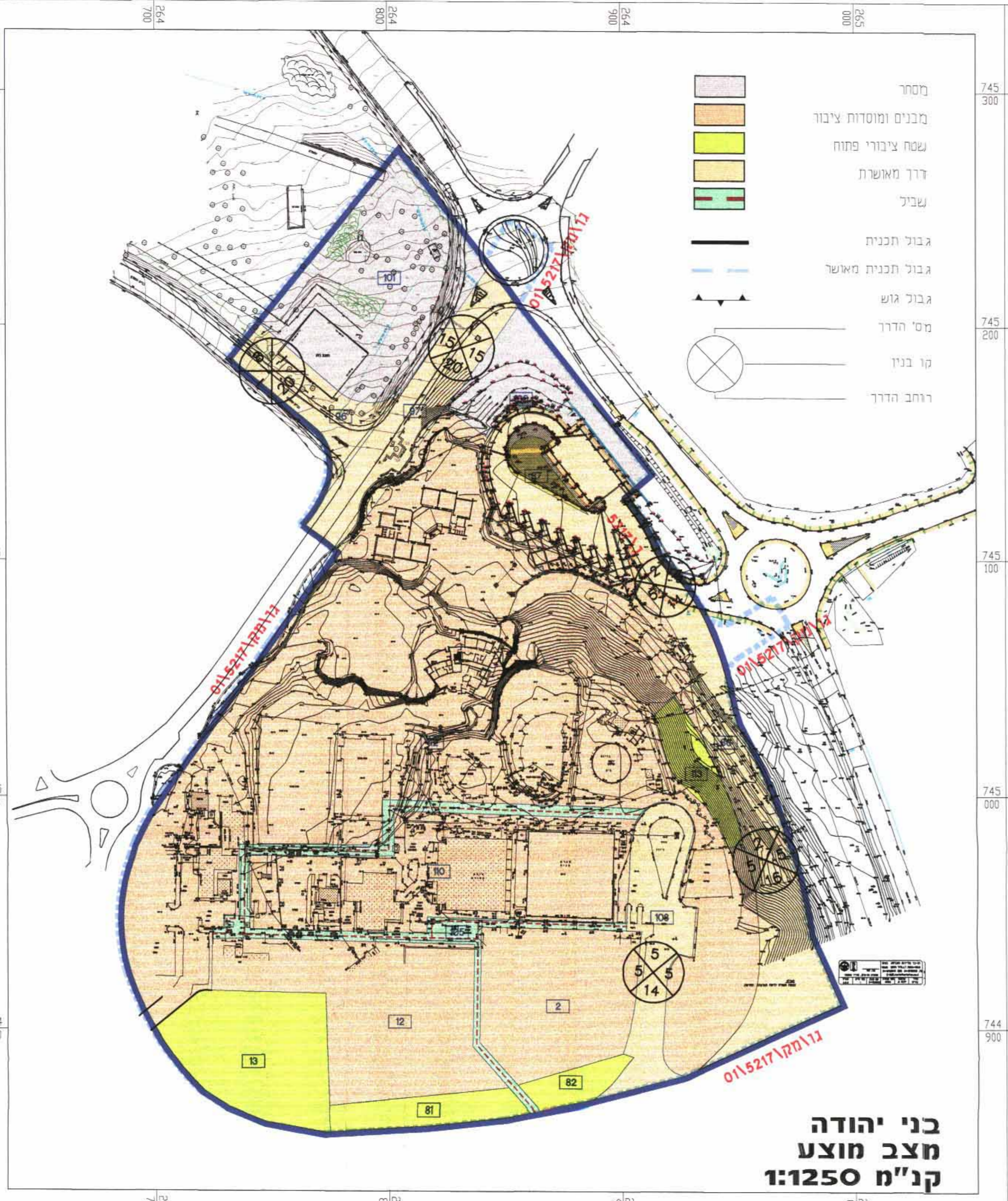
בני יהודה מצב מוצע קנ"מ 1:1250