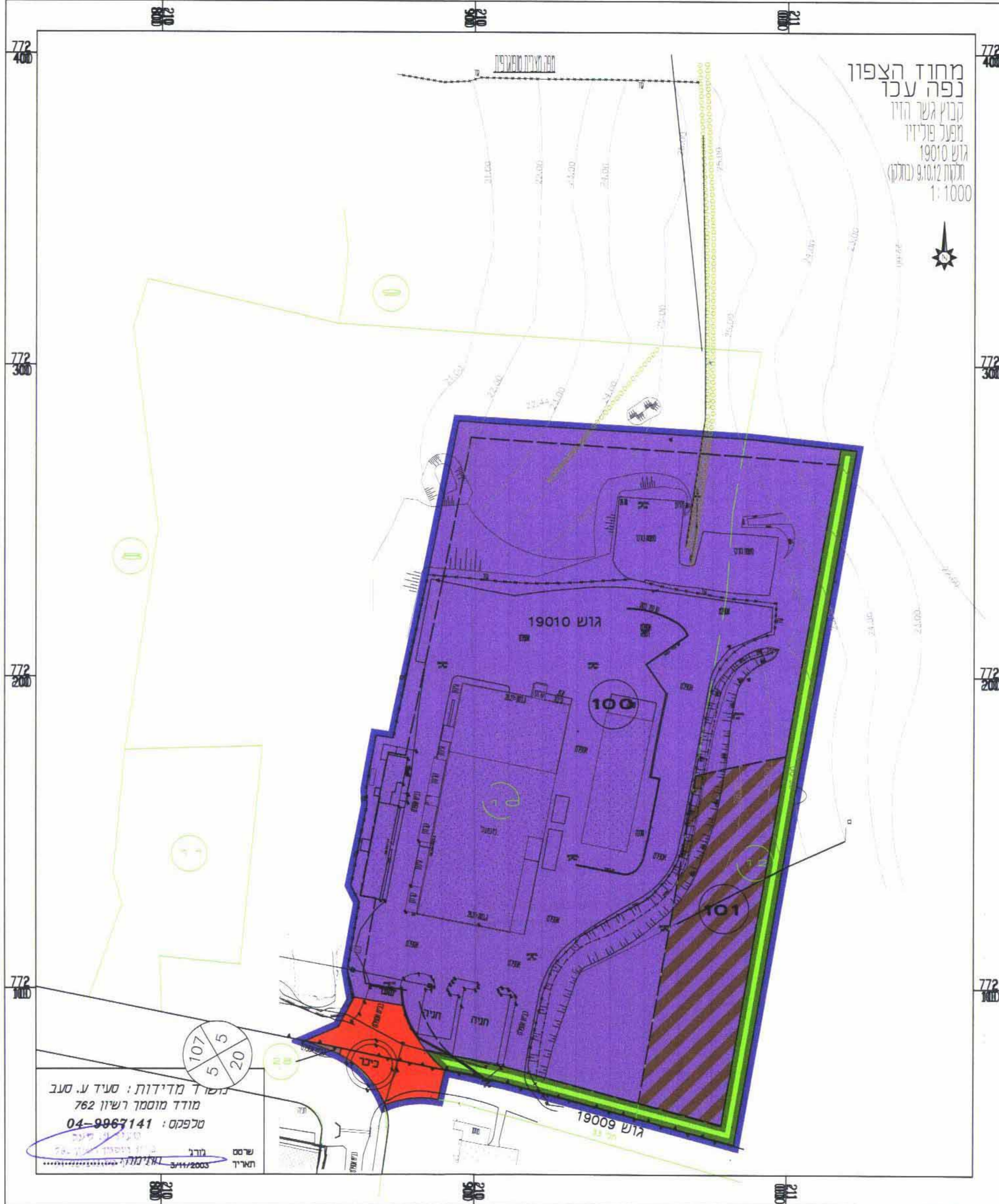
מצב מוצע 1:1000