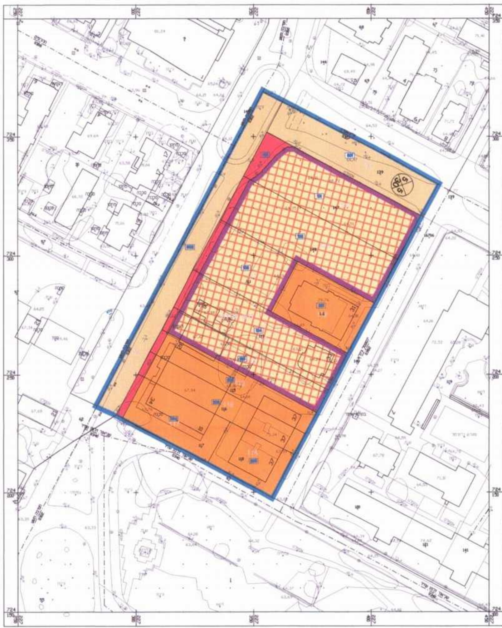
מצב מאושר 1 : 1000