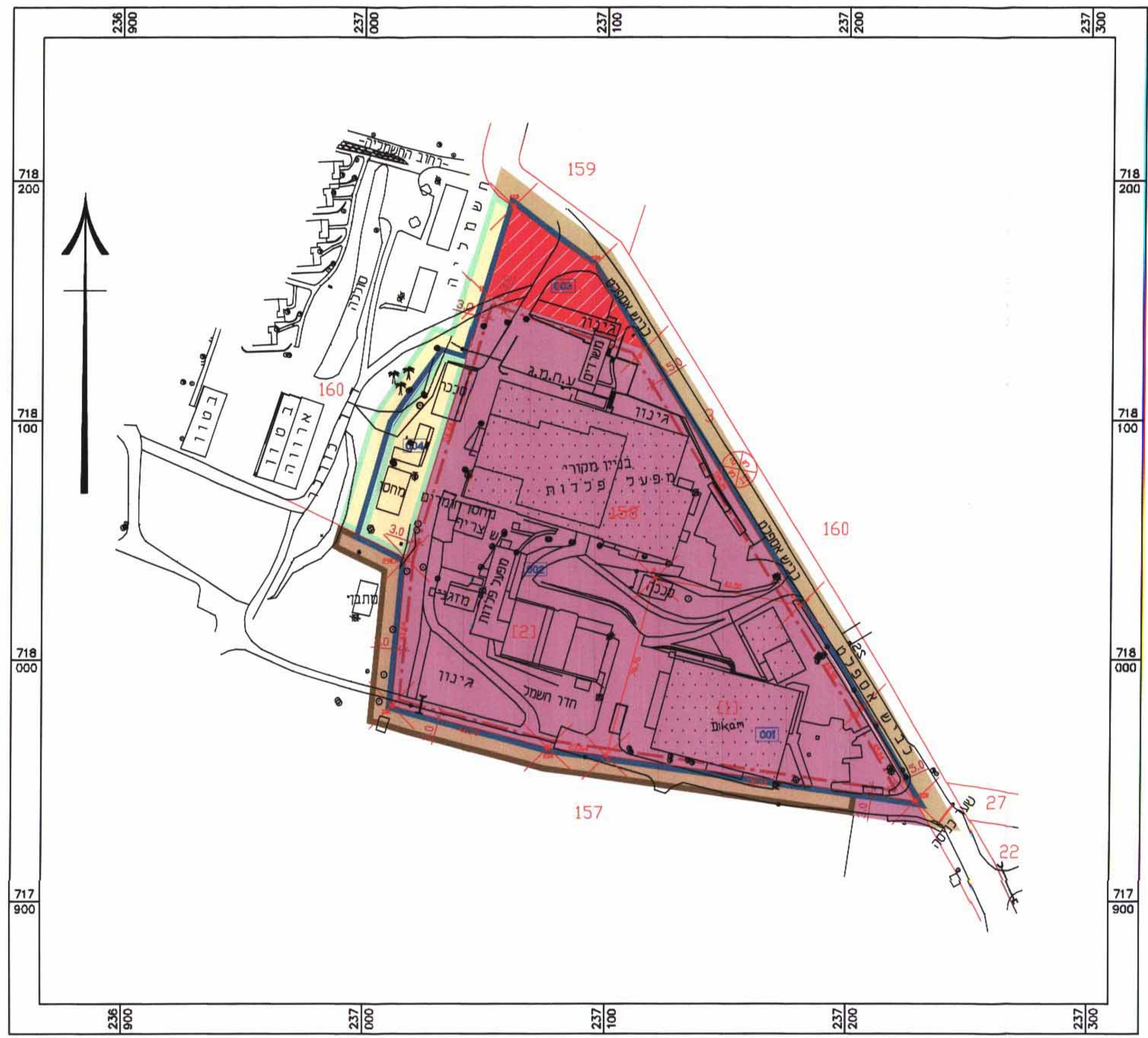
מצב מאושר קנ"מ 1 : 1250