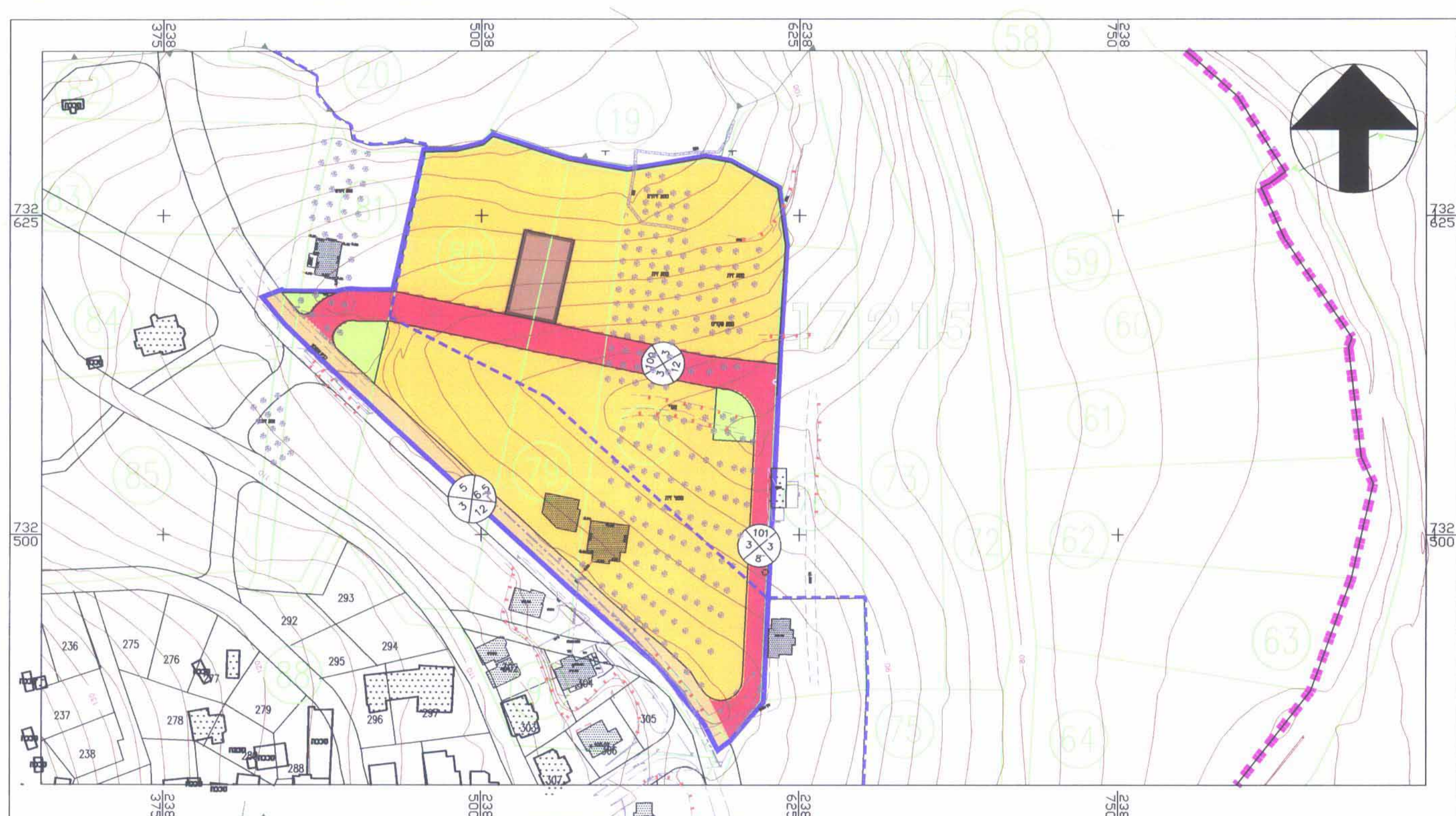
מצב מוצע קנ"מ: 1:1250

משרד המגורים מחוז הצפון מספר תכנון: 13800/ג תאריך: 23.02.08 מסמך: 5835 מספר: 16.07