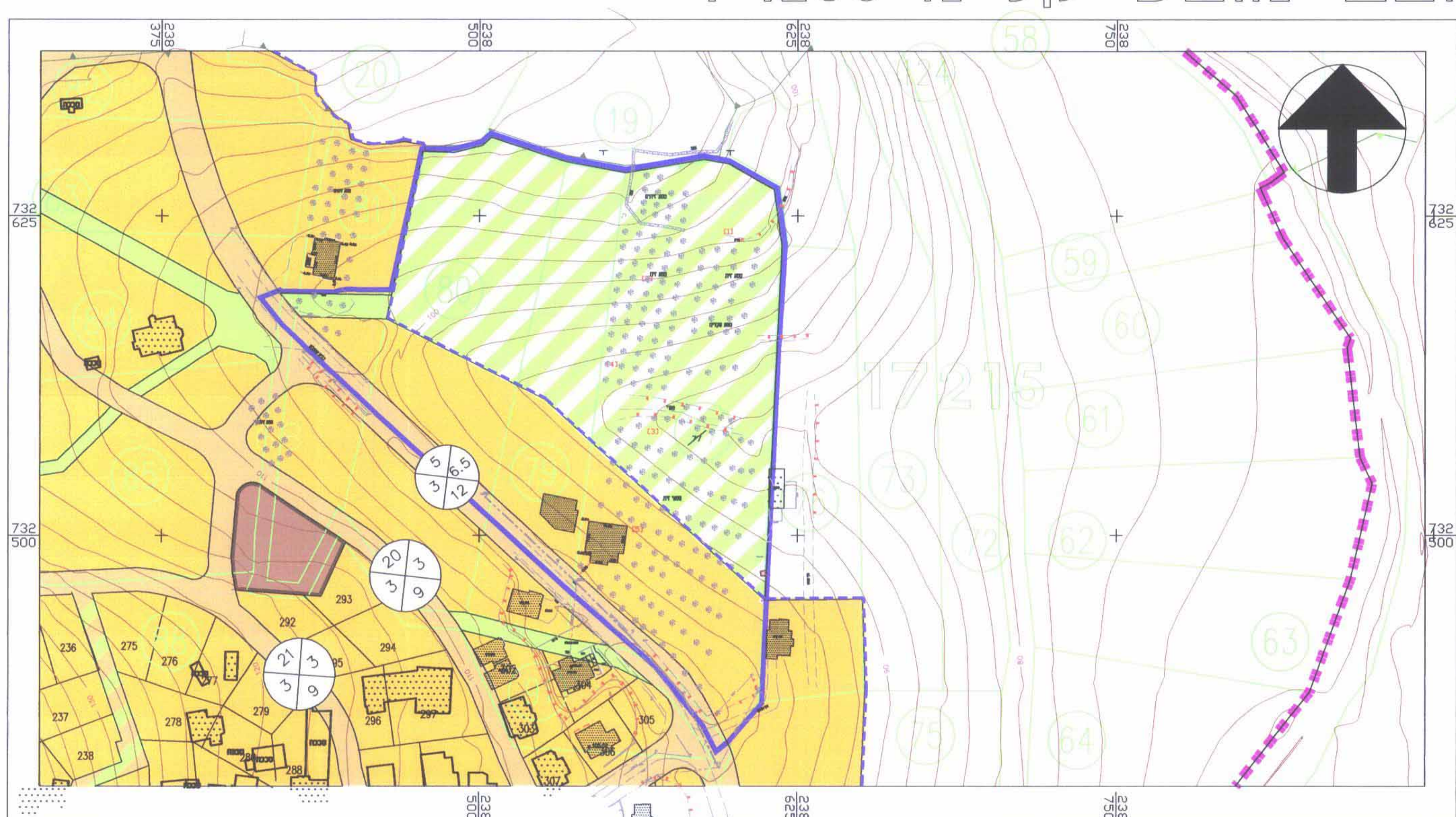
מצב קיים קנ"מ: 1:1250