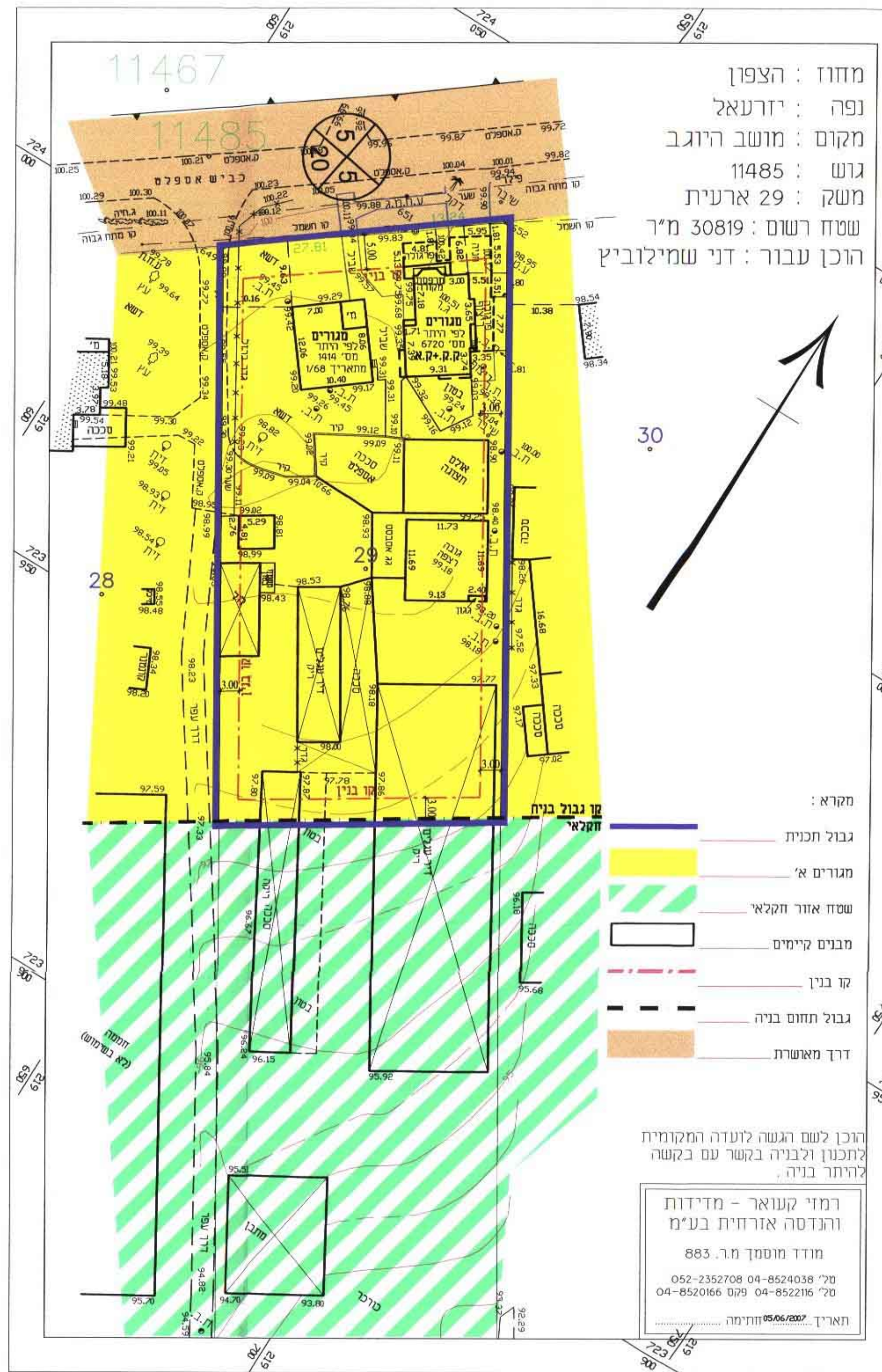
תכנית מצב קיים קנ"מ 1:500