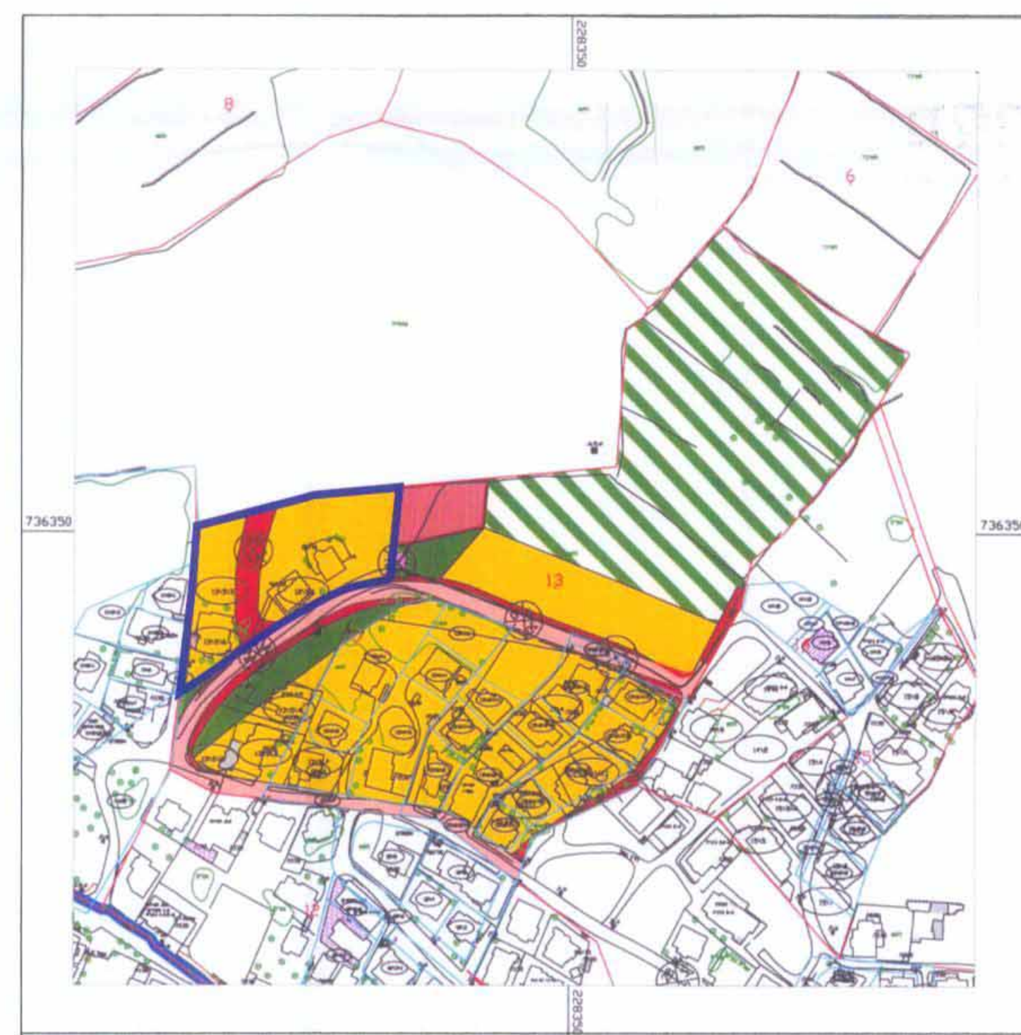
תרשים סביבה קנ"מ 1:1250