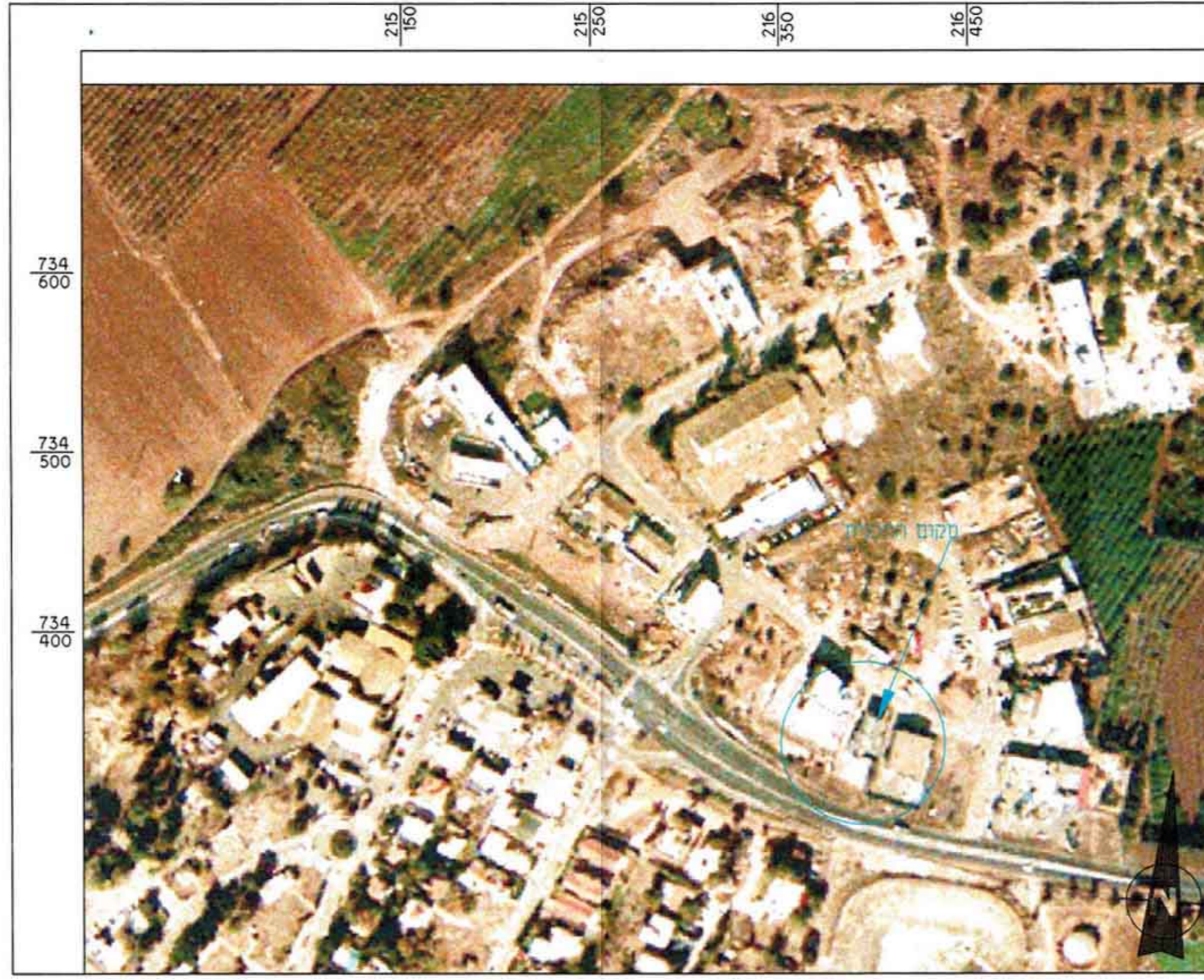
מפת אורטופוטו רמת ישי- שכונת קדמת ישי