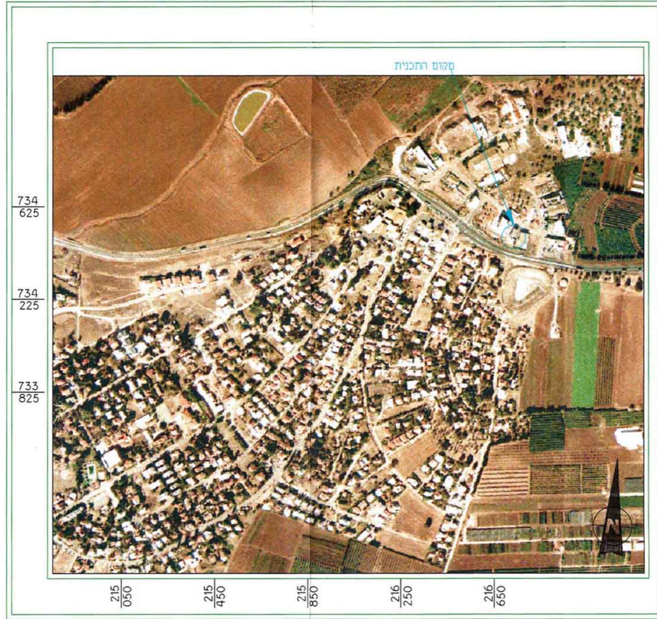
מפת אורטופוטו רמת ישי- קנ"מ 1:10000