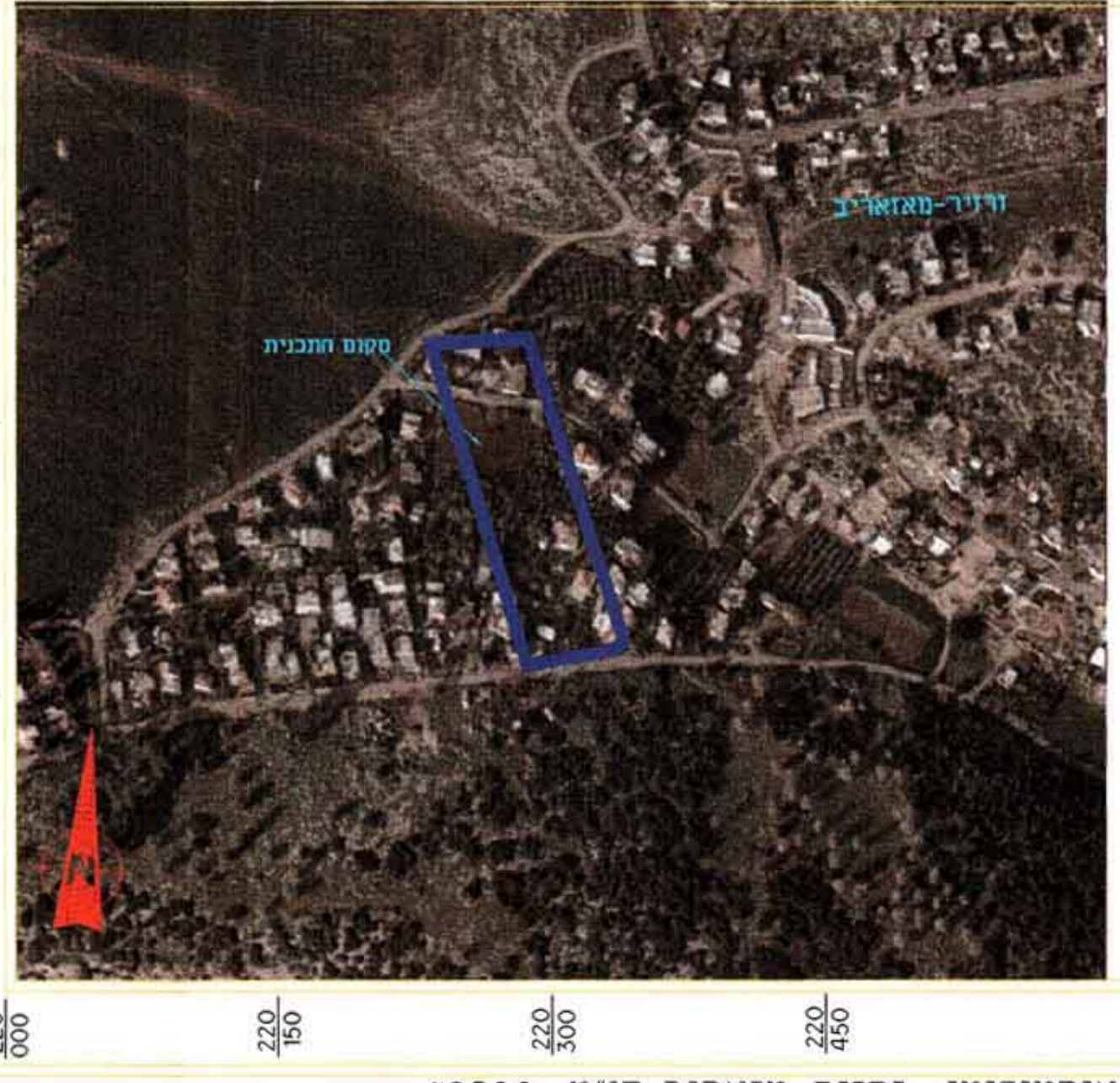
מפת אורטופוטו - זרזיר-מזאריב קנ"מ 1:2500