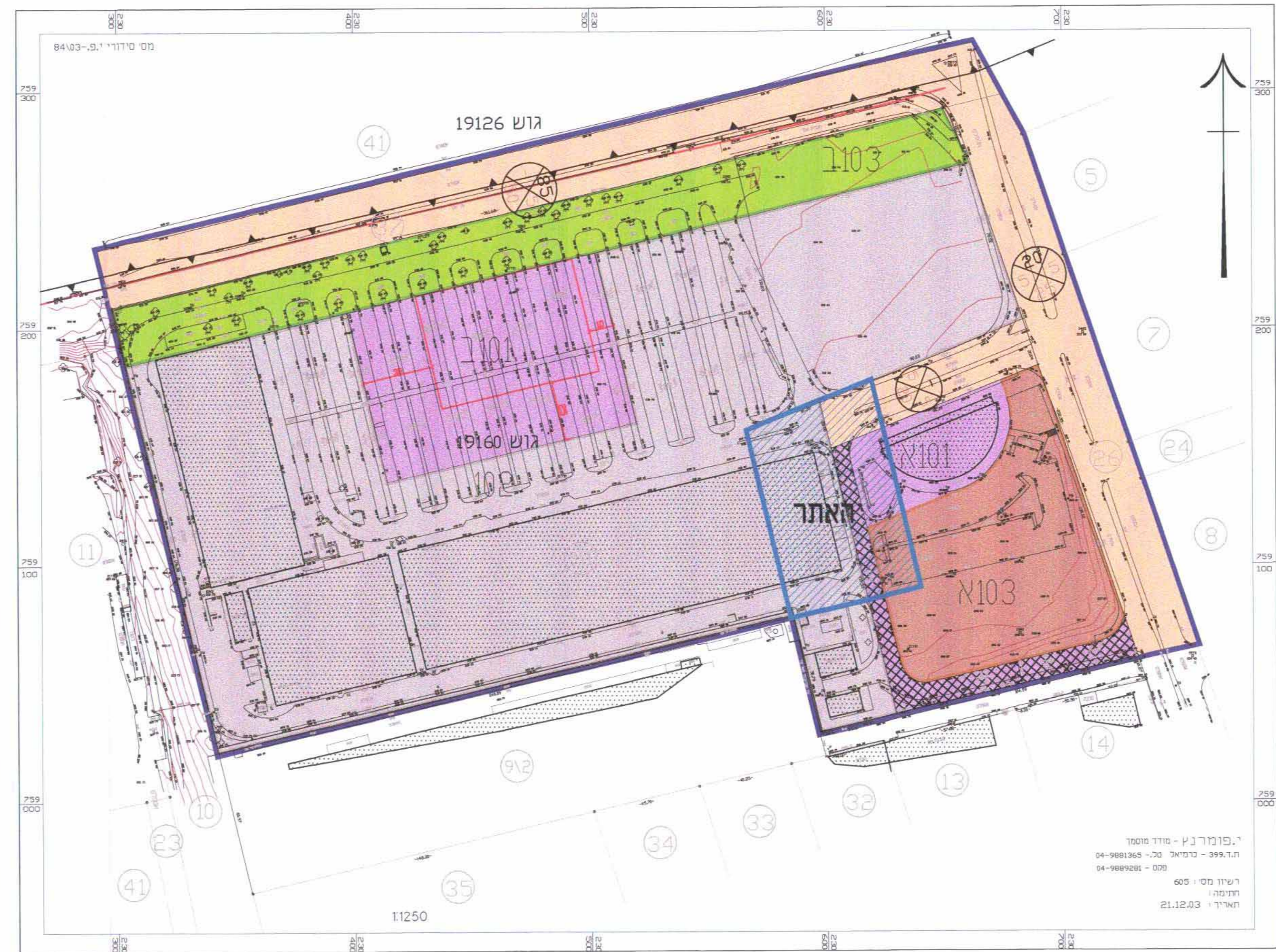
תרשים סביבה על בסיס תכנית מק/כר\9599\קנ"מ 1:1250