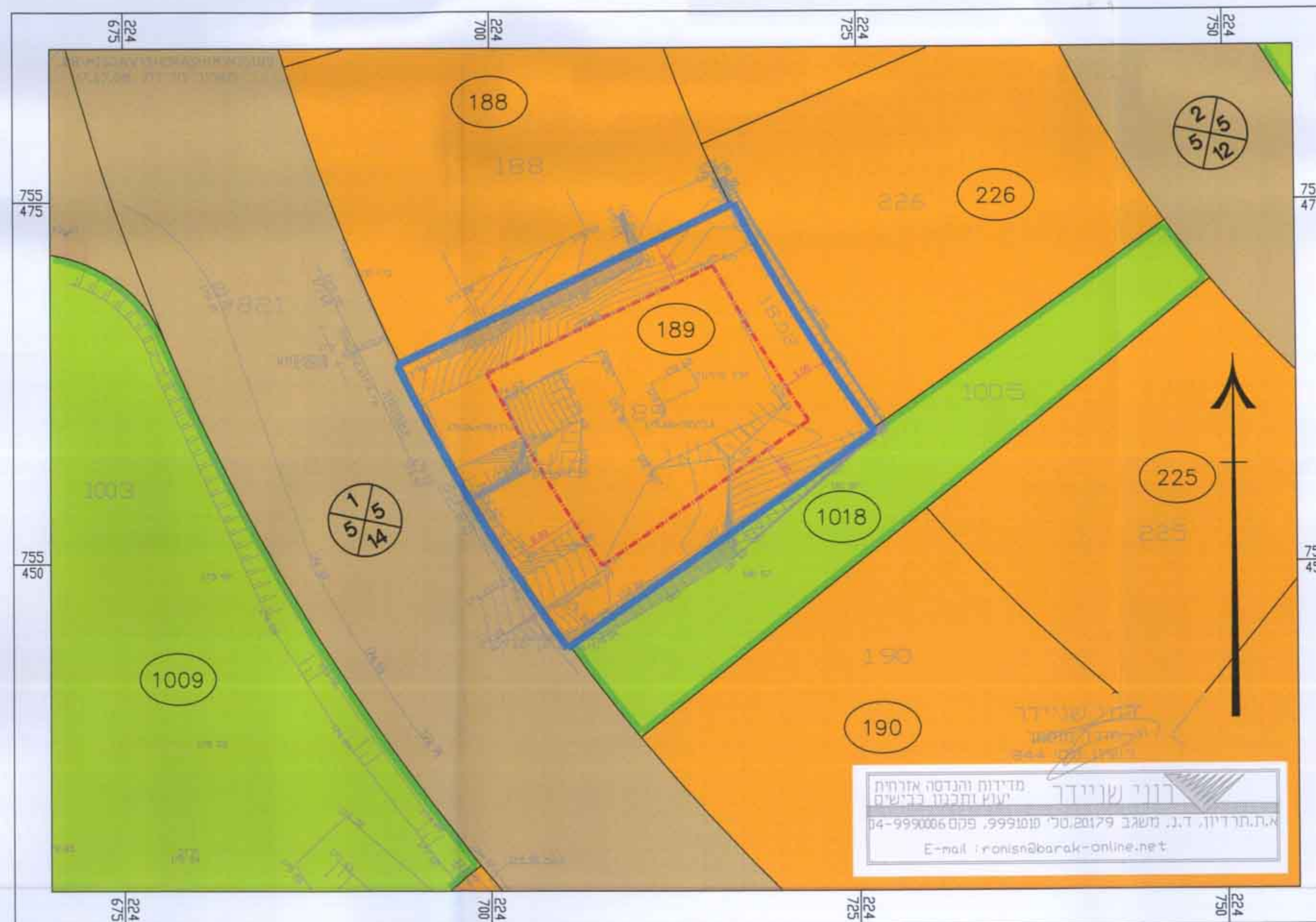
מצב מאושר 1:250