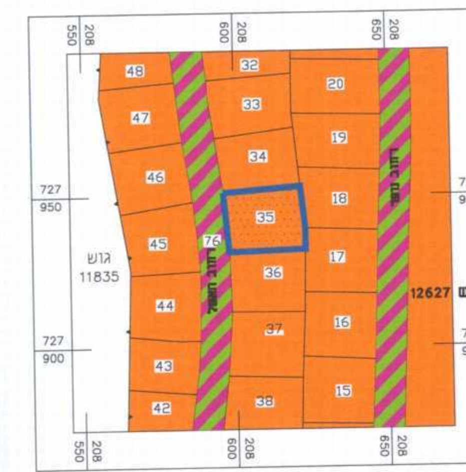
תרשים סביבה קנ"מ 1 : 1,250