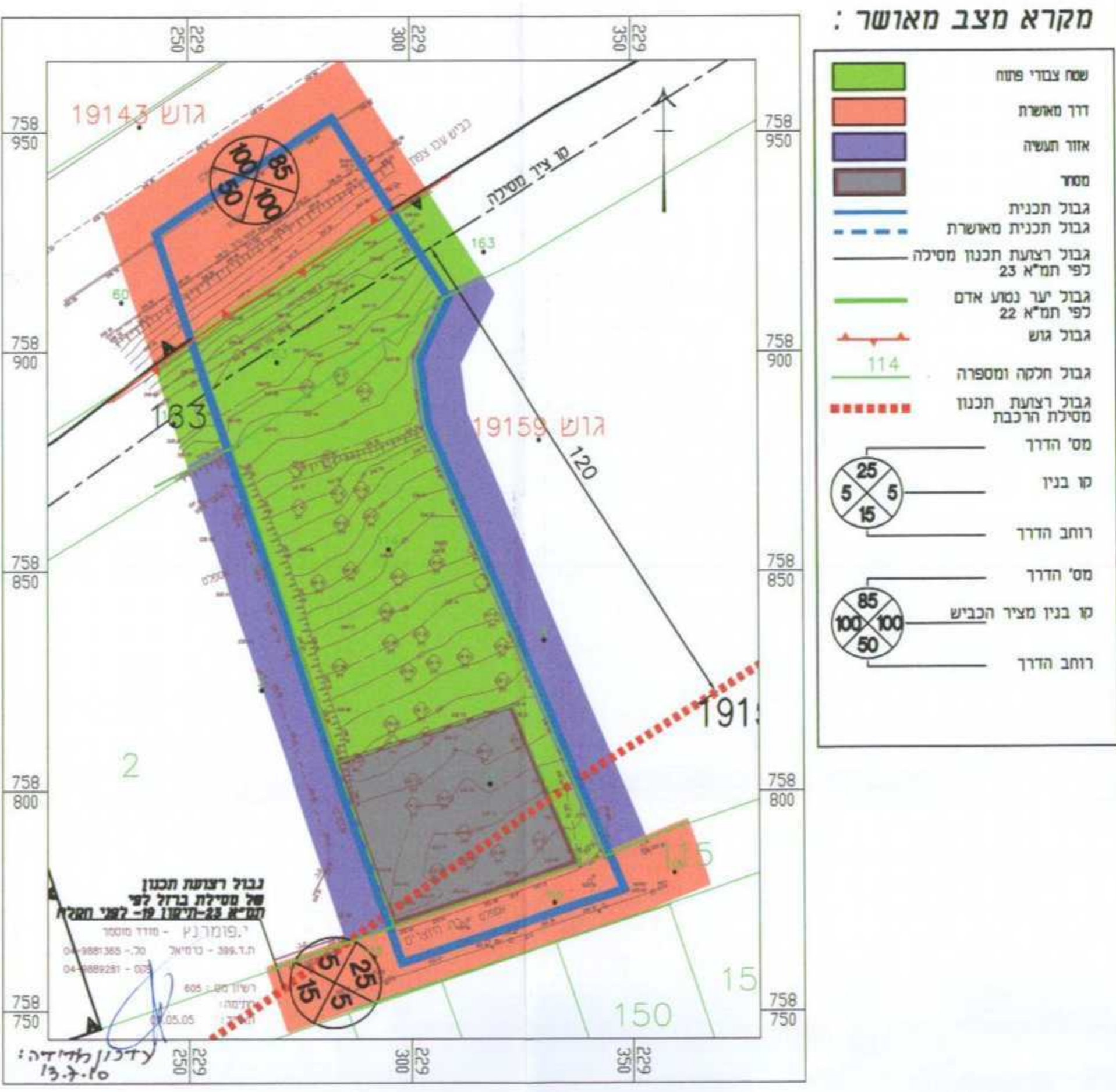
מצב מאושר קני"מ 1 : 1000