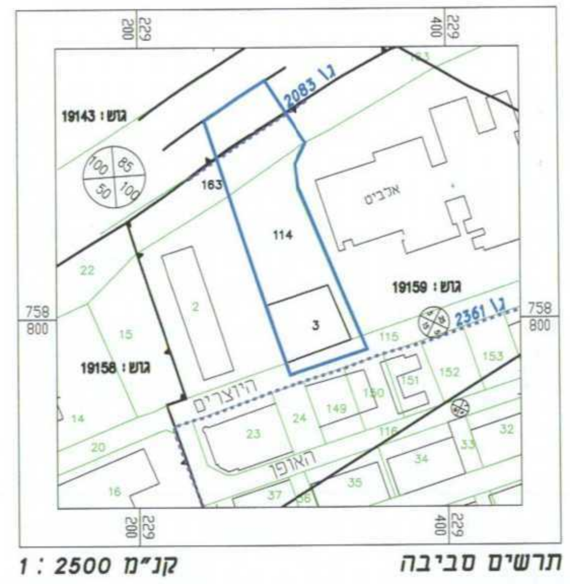
תרשים סביבה קני"מ 1 : 2500