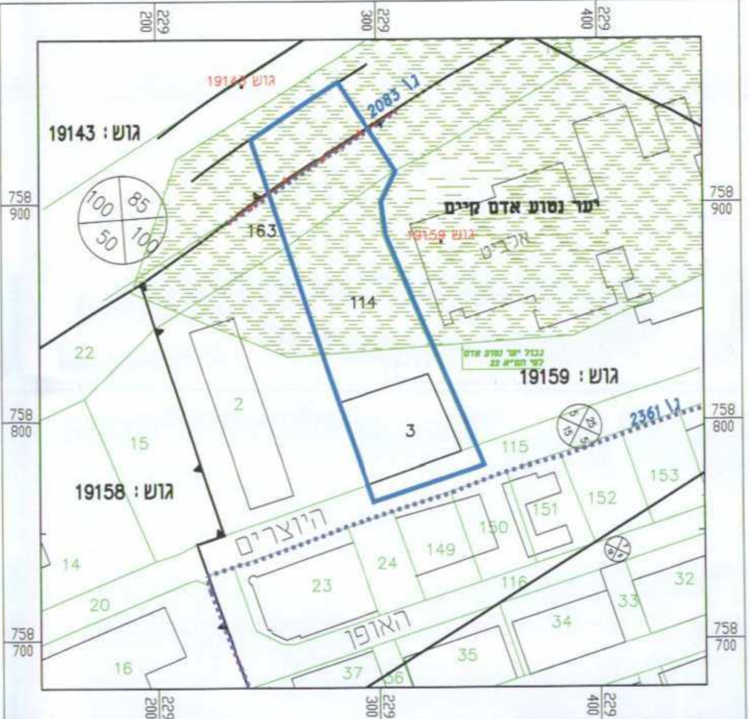
תמ"א 22 ליער ויעור קני"מ 1 : 1,750

סה"כ השטח הנגרע מהיער ע"י התכנית המוצעת: 5.74 דונם