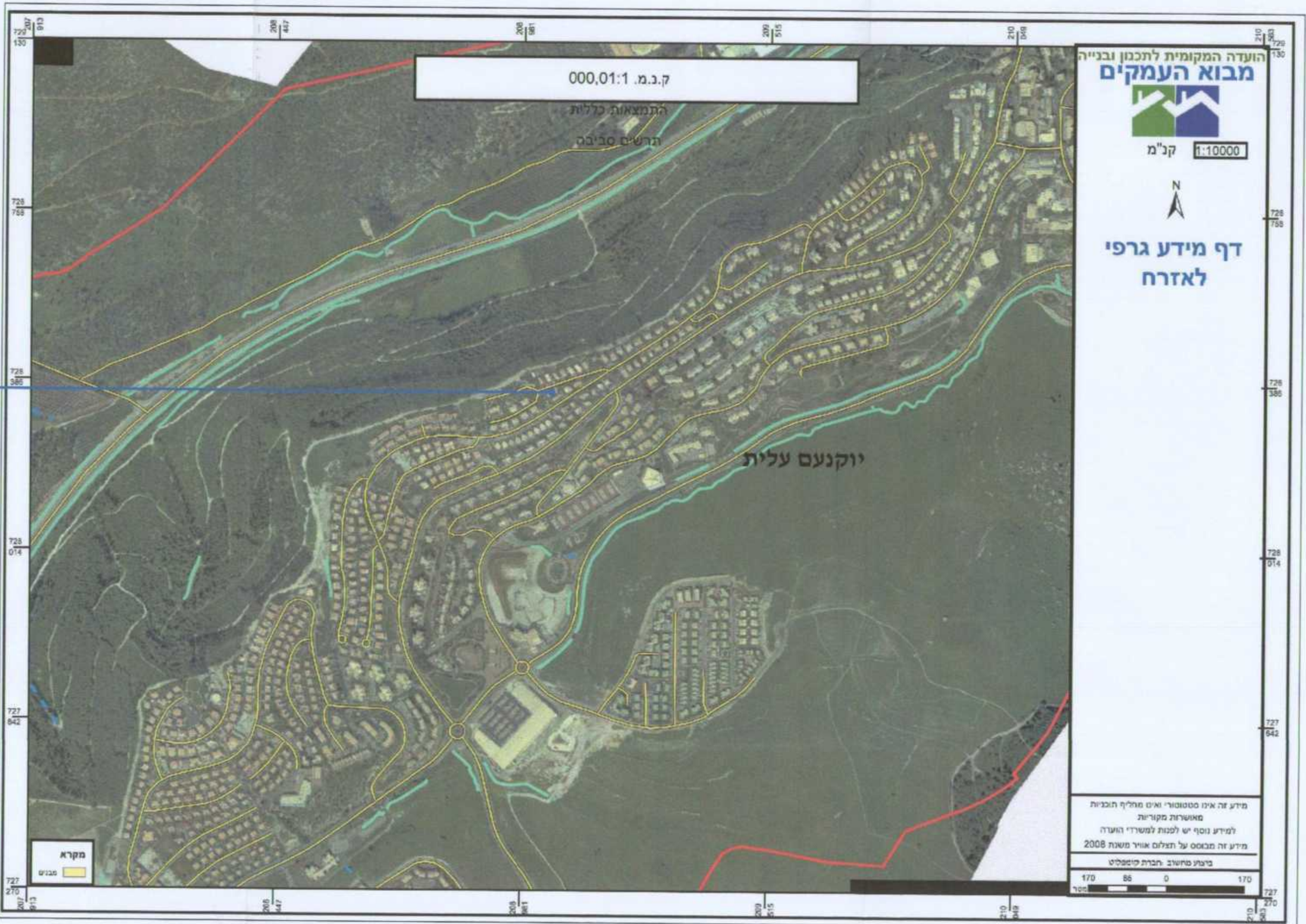
תוכנית התמצאות כללית 1:10,000